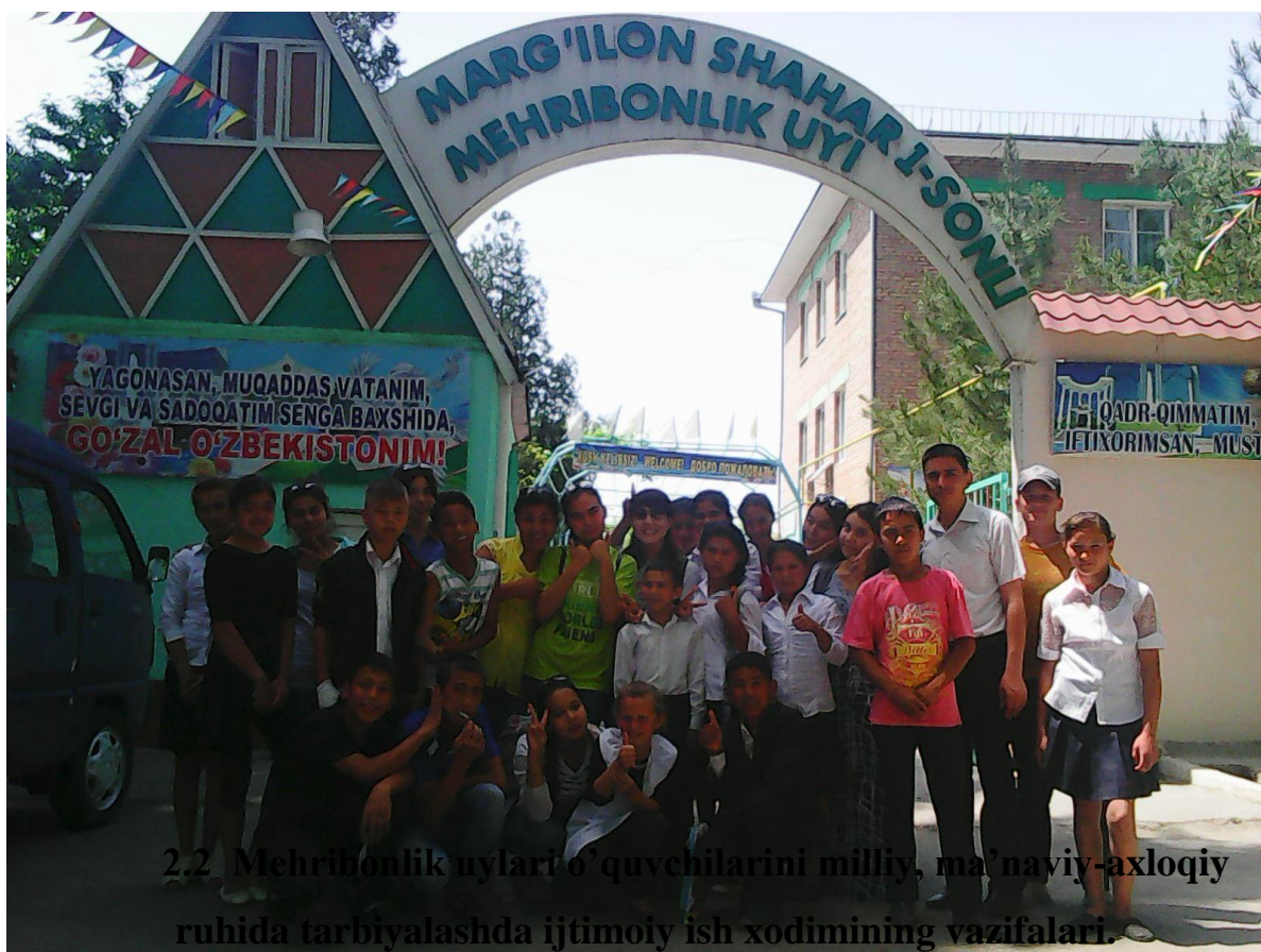
2.2 Mehribonlik uylari o'quvchilarini milliy, ma'naviy-axloqiy ruhida tarbiyalashda ijtimoiy ish xodimining vazifalari.

Ijtimoiy ish xodimlari Milliy Assotsiatsiyasi ijtimoiy ish xodimi kasbini "insonlar, guruxlar yoki hamjamiyatlarga ijtimoiy faoliyatlari uchun imkoniyatlarni oshirish yoki tiklash masalasida va ushbu maqsadlarni bajarishda imkon beruvchi ijtimoiy sharoitlarni yaratishda ularga yordam ko'rsatuvchi ijtimoiy faoliyat" deb ta'riflaganlar. 15