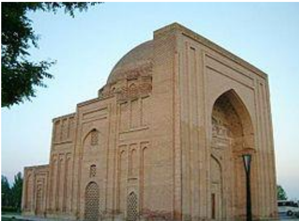
Хоруния макбараси (Хорун ар-Рошид). Тус - Жанубий Эрон, ҳозирги Машҳад шаҳри. Имом Ғаззолийнинг қабри тахминан кириш қисмининг ёнида бўлган.