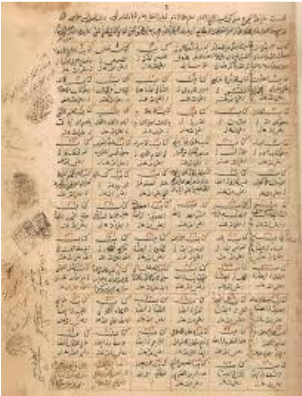
Ибн ал-Арабийнинг сақланиб қолган асл қўлёзмалари “Футуҳот ал-Маккийя” асаридан.