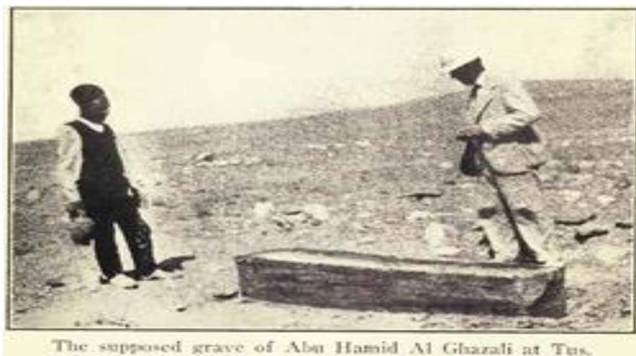
The supposed grave of Abu Hamid Al Ghazali at Tus.