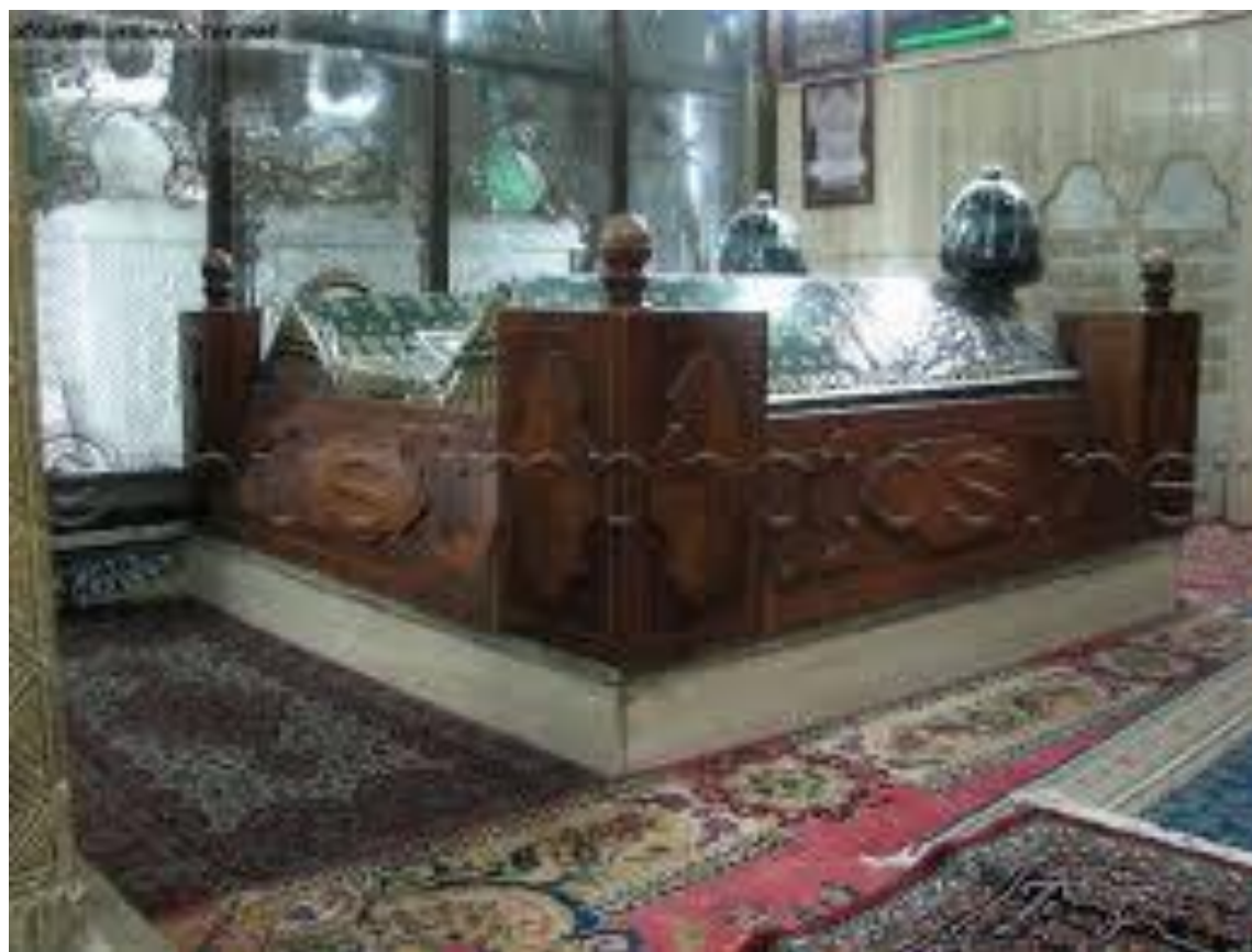
Усманий султон Салим I нинг Ибн ал-Арабий қабри устига қурдирган мақбаранинг ички кўриниш