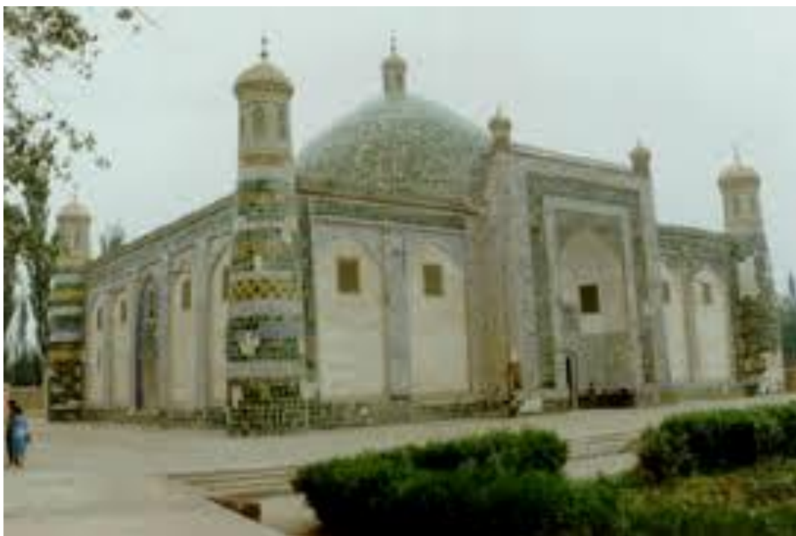
Усманий султон Салим I нинг Ибн ал-Арабийга қурдирган мақбараси. Дамашқ, Салиҳий шаҳарчаси, Сурия