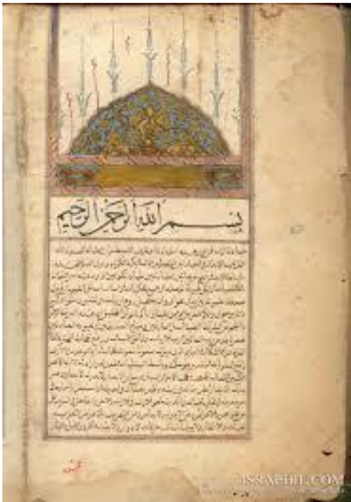
Ибн ал-Арабийнинг ўша давр хаттотлари томонидан нақшлар билан безатилган асл қўлёзмаларидан бири.