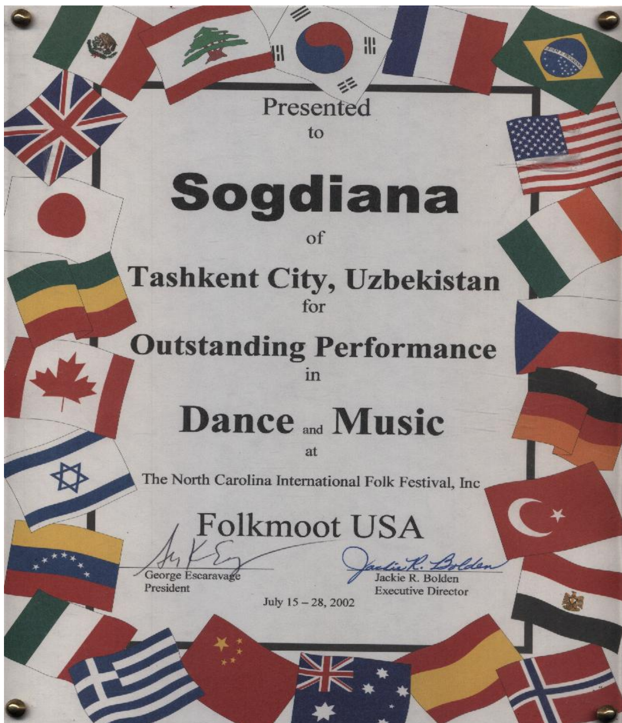
“FOLKMOOT” (AQSH, 2002 YIL)