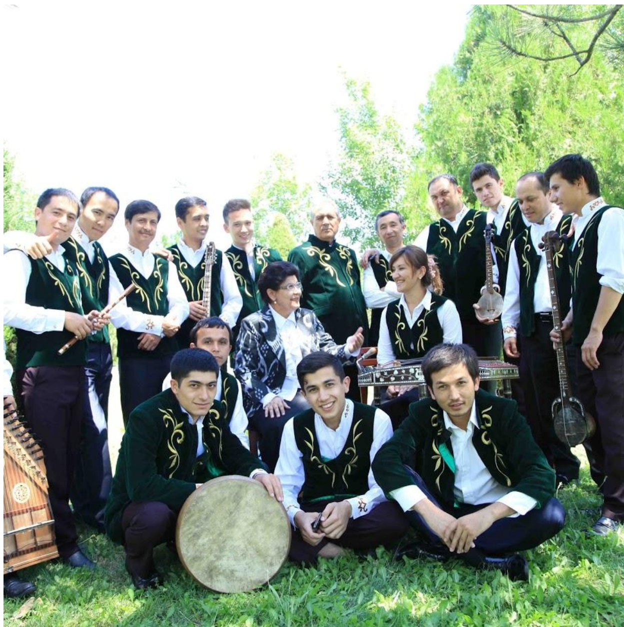
“So’g’diyona” o’zbek xalq cholg’ulari kamer orkestri jamoasi

Avvalambor har bir orkestr musiqachilarsiz bo’lmaydi. Chunki, sozandalarning ijro vositasi cholg’ulari bo’lsa, dirijorning ijro vositasi bu – orkestr