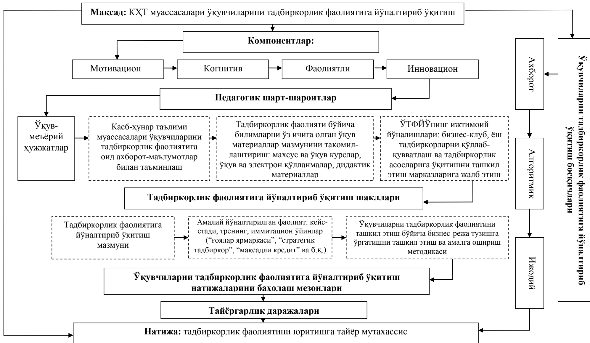
1-расм. Касб-хунар таълими муассасалари ўқувчиларини тадбиркорлик фаолиятига йўналтириб ўқитишнинг педагогик тузилмаси