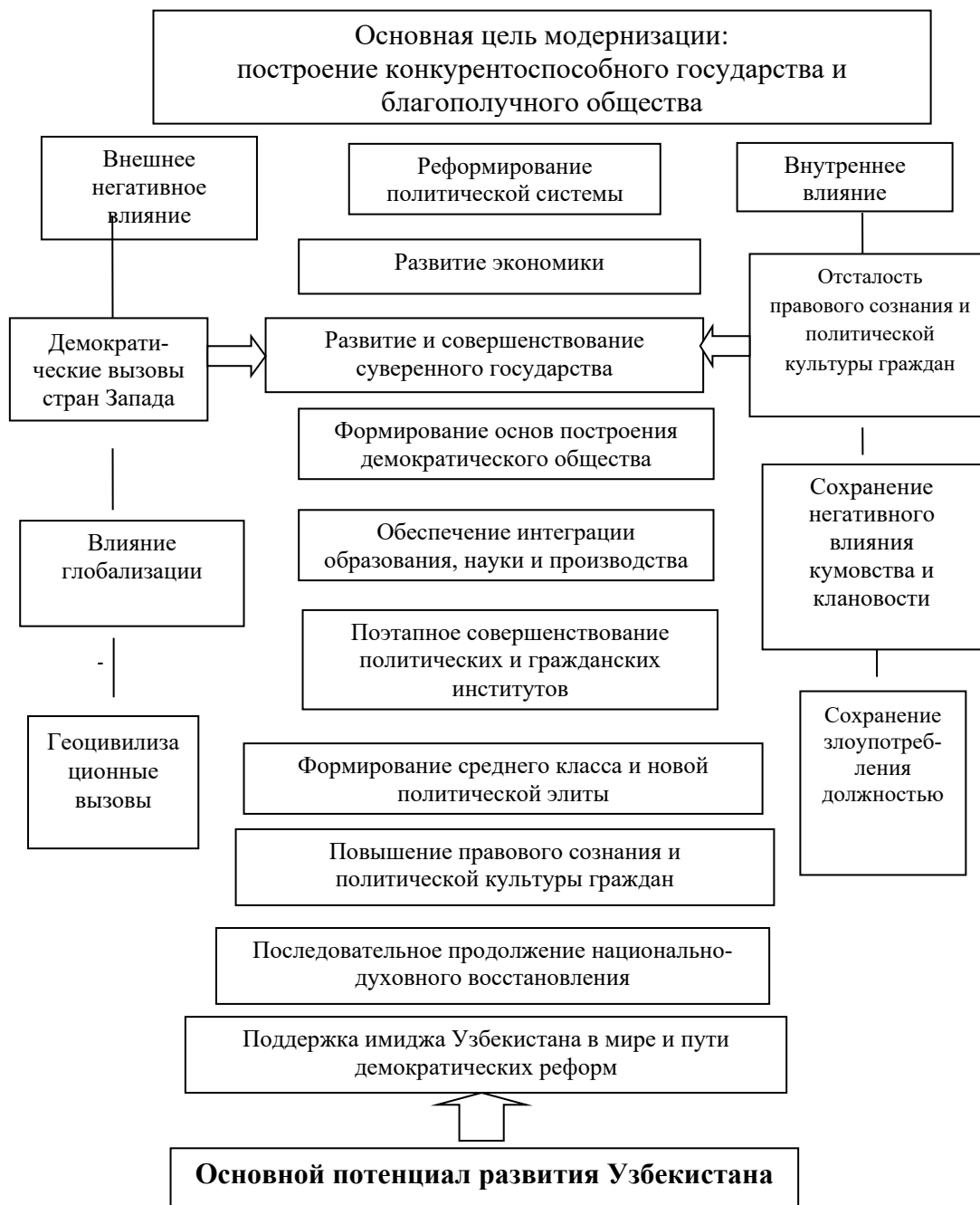
Рисунок 2. Задачи модернизации общества в Узбекистане в условиях глобализации

которой анализируются внутренние и внешние угрозы, препятствующие модернизации, 10 факторов, определяющих основной потенциал республики (см. Рисунок 2).