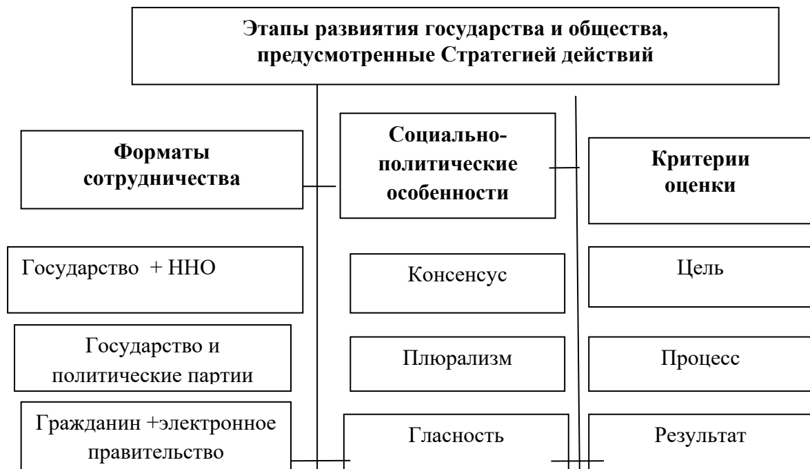
Рисунок 1. Отношения социального сотрудничества между государством и обществом

Вместе с тем, в исследовании раскрыты этапы развития государства и общества, а также критерии оценки сотрудничества в этом вопросе (см. Рисунок 1).