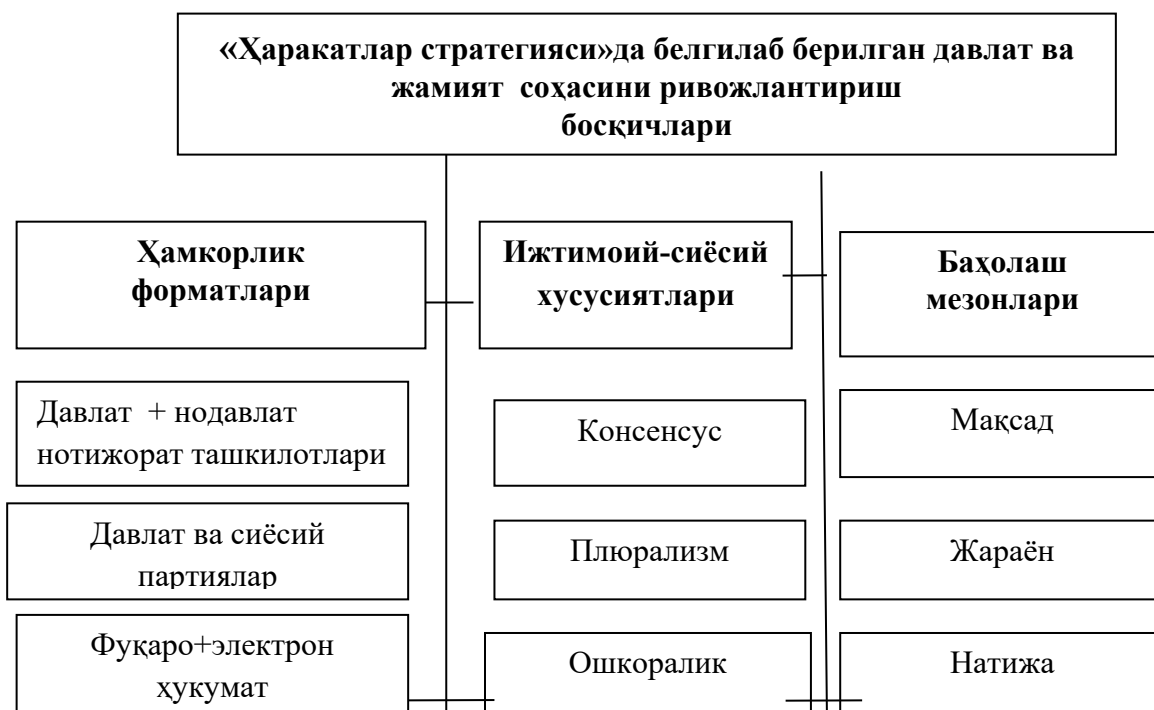
1-расм. Давлат ва жамият ўртасидаги ижтимоий ҳамкорлик муносабатлари

ислохотларнинг моҳияти, самаралари қиёсий таҳлил этилди ва илмий хулосалар чиқарилди.