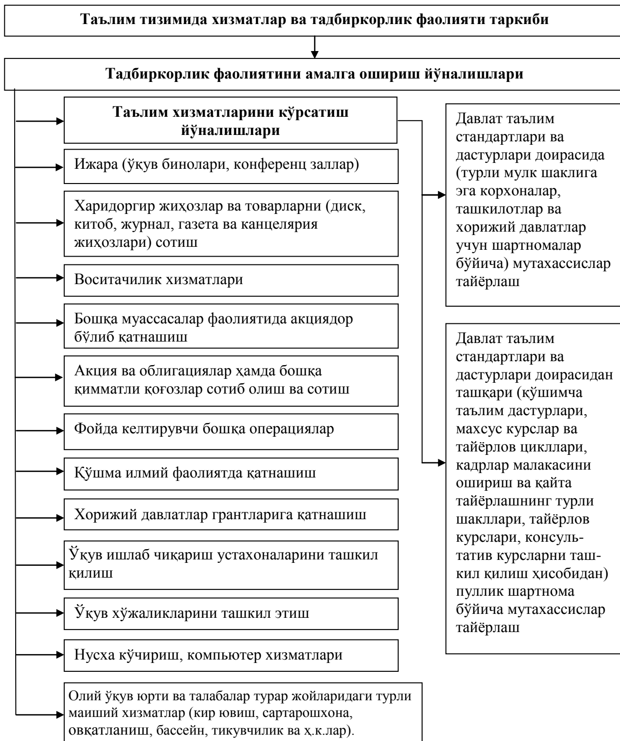
1-расм. Таълим тизимида хизматлар ва тадбиркорлик фаолияти таркиби

Ишда иқтисодиётни модернизациялаш шароитида таълим хизматлари ва тадбиркорлик фаолиятининг таркиби тизимлаштирилган ва такомиллаштирилган (1-расм).