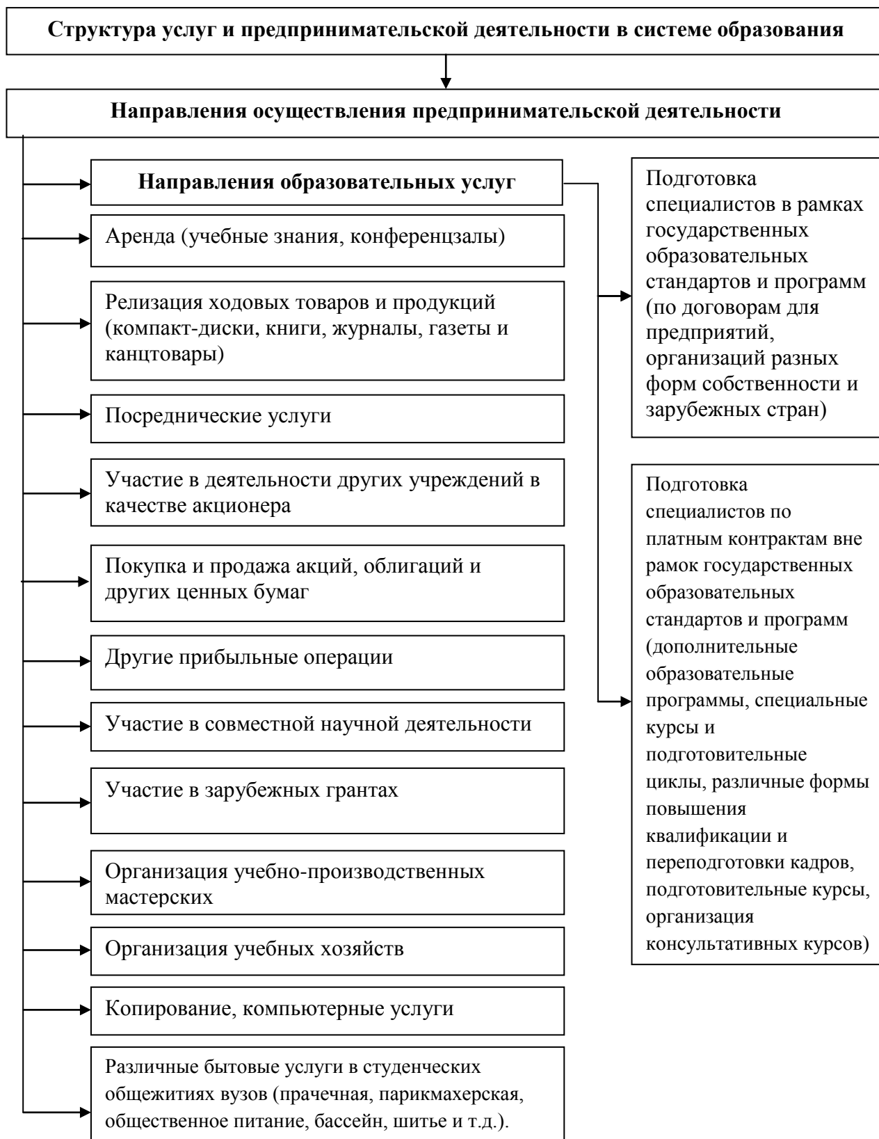
Рисунок 1. «Структура услуг и предпринимательской деятельности в системе образования» 20

продуктов, также создает некоторые проблемы для повышения и оценки эффективности.