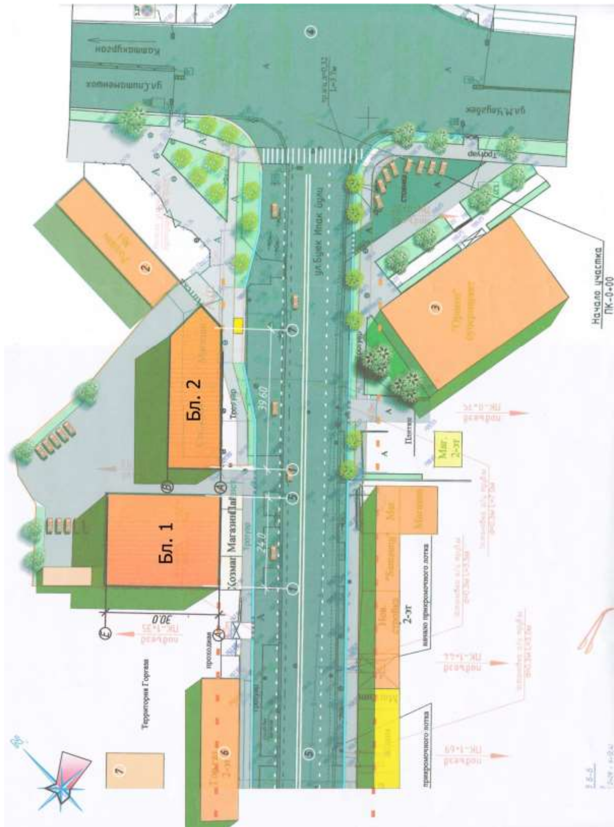
Фото 1. Ген план территории. Строительство зданий ТБК с жилыми квартирами на 3-м этаже по ул. Ипақ Юли 17, в г. Самарканде.