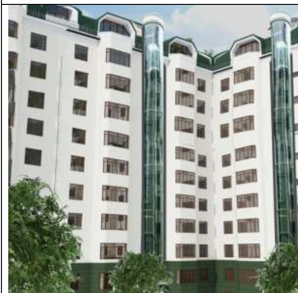
Проект многоэтажного жилого комплекса