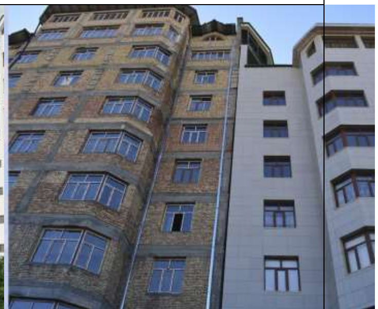
Процесс строительства жилого комплекса.