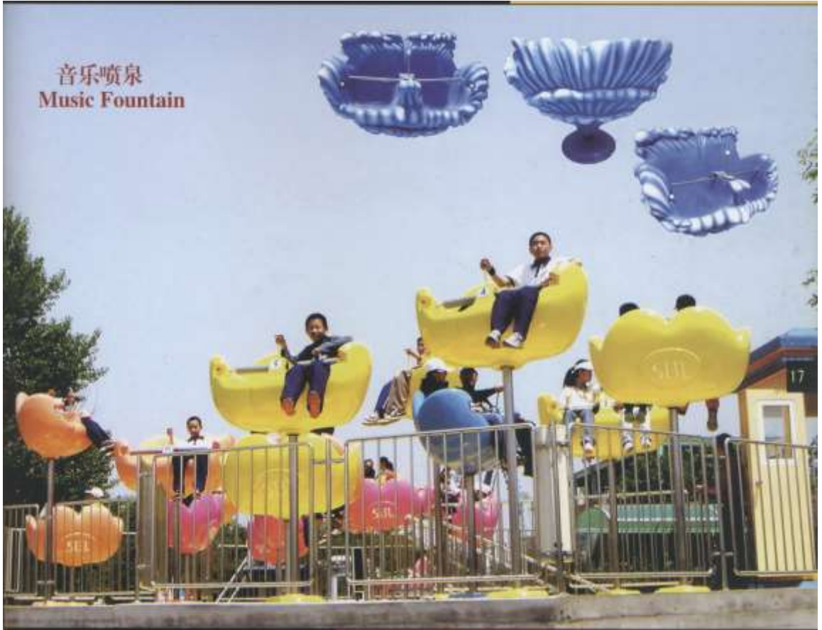
音乐喷泉 Music Fountain