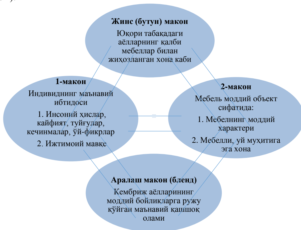
1-расм. Furnished souls метафорик бленди концептуал интеграцияси чизмаси

безатилган хонага ўхшайди деб тавсифланади. Жинс (бутун) макон структурасида икки асосий концептуал ибтидо: моддият ва мавхумликни ўзаро боғлаб турувчи жисмлаштириш жараёни актуаллаштирилади. Бленднинг шаклланиши натижасида индивидуал-муаллифлик проекцияси содир бўлади ва унга кўра, биринчи макондан инсоний ҳислар, кайфият, туйғулар, кечинмалар, ўй-фикрлар, шунингдек, юқори ижтимоий мавқе мажмуавий тарзда олдинги планга чиқарилади. Иккинчи макондан эса мебелларнинг, мебелли уй муҳитига эга хонанинг моддий характери олдинга чиқади. Оқибатда, янги интеграциялашган макон, яъни бутун метафорик конструкциянинг маъносини белгилаб берувчи бленд шаклланади: Кембриж аёлларининг моддий бойликларга ружу қўйган маънавий қашшоқ олами (1-расм).