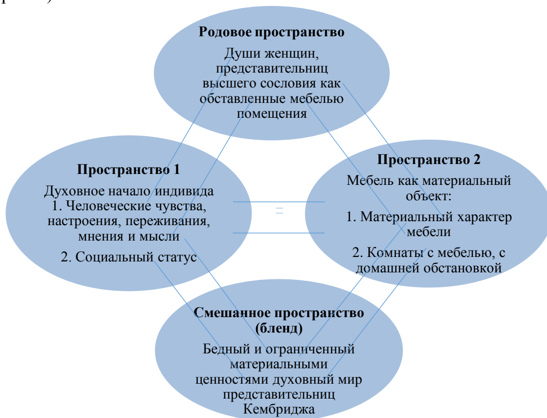
Рис. 1. Схема концептуальной интеграции метафорического бленда Furnished souls

индивидуально-авторская проекция, в рамках которой из первого пространства на передний план в совокупности выдвигаются человеческие чувства, настроения, переживания, мнения и мысли, а также высокий социальный статус. Из второго пространства выступают материальный характер мебели, комнаты с мебелью, с домашней обстановкой. В итоге формируется новое интегрированное пространство, т.е. бленд, который определяет смысл всей метафорической конструкции: бедный и ограниченный материальными ценностями духовный мир представительниц Кембриджа (см. рис. 1).