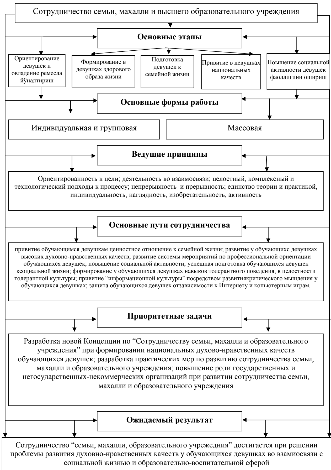
Рисунок 1. Модель развития национальных духовно-нравственных качеств обучаюшихся девушек