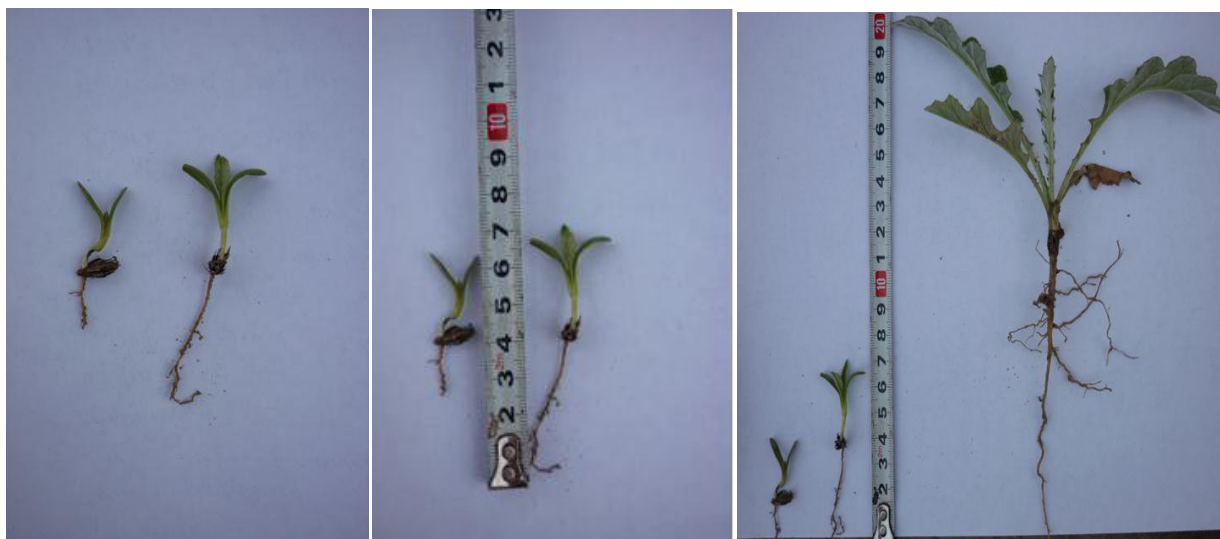
Рис. 4. Развитие от семени Мордовника

Интродукционная оценка процесса адаптации и результатов введённых растений осуществляется с помощью различных методов или баллами по шкале на основе интродукционных условий, в которых растут растения, характеристики роста и развития, и образа жизни растений. Эта шкала, разработанная Б. Ё.Тўхтаевым (2009), состоит из 5 показателей и разделена на три уровня (высокий, средний или низкий).