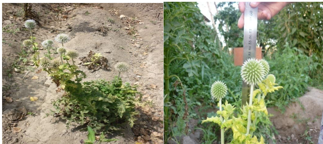
Рис. 2. Цветение Мордовника обыкновенного ( Echinops ritro .)

Стебли одиночные, реже ветвистые в верхней части, опушённые. Листья чередующиеся, глубоко надрезанные, длиной 6-20 см, расположены в очередном порядке: вверху тёмно-зелёные, снизу бело войлочные, цветки трубчатые, голубые в одноцветковых корзинках, собранных в крупные шаровидные соцветия, диаметром 3 - 5 см, плод- цилиндрическая семянка, длиной 6 мм, с чашевидным хохолком.