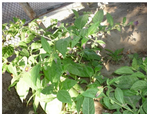
Рис. 1. Цветение белладонны ( Atropa belladonna )