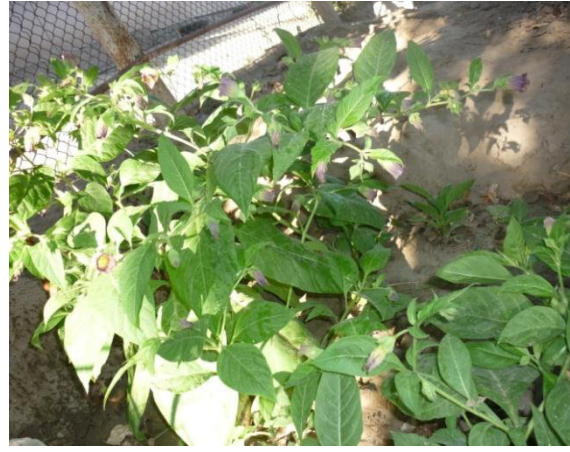
1-расм. Оддий белладоннанинг гуллаши ( Atropa belladonna )

Оқ қундуз - қуёш севар, қурғоқчиликка чидамли ва беор ўсимлик, хар қандай тупрокда ўсади, унумдор тупроқларда бақувват поялар шаклантиради ва кўп уруғ беради. У тупрокдаги сув турғунлигига чидамайди. Бу эса илдизларни чиришига олиб келади. Биринчи йилда тўп барг шаклантиради. Пояси битта ёки тепасида кам шоҳли думалоқ, майда тукли. Барглари навбатли, чуқур кесилган узунлиги 6-20 см, юқорида тўк яшил, остида оч тукли, гуллари найчали, мовий, йирик тўп гулларга йиғилган, диаметри 3,5-4,5 см бўлган, шарсимон меваси цилиндр шаклида узунлиги 6 мм коса симон гултожга эга.