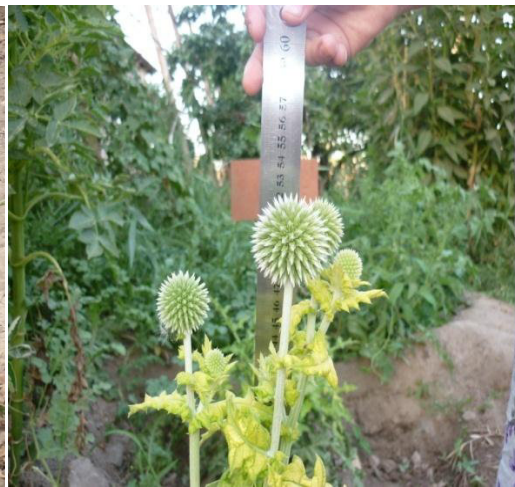
2-расм. Оқ қундузнинг гуллаши ( Echinops ritro )

Ялпи гуллаш даври узокроқ давом этиб, июль ойидан сентябрь ўрталаригача ва якуний гуллаш октябрь бошларигача давом этиши аниқланди. Июль ойининг ўрталаридан ялпи гуллаш даврига ва октябрнинг биринчи декадасидан гуллаш фазасининг якуний даврига ўта бошлади. Кузатишларимизга кўра, ўсимликда гуллаш тартиби кўйидагича содир бўлади. Қорақалпоғистон шароитида ниҳоллар униб чиқишидан биринчи мевалар пишгунига қадар 120-130 кун керак бўлади. Фенологик ривожланиш фазалари турнинг биологик хусусиятларига, иқлим шароити ва экиш вақтига боғлиқдир. Қиш мавсуми ва эрта баҳор экиш муддатлари уруғларни эрта ва тез униб чиқишини ва кейинги фазаларнинг бошланиши кеч баҳорги