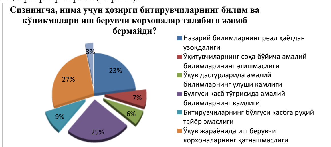
2-расм. Олий таълим битирувчиларининг иш берувчи талабларига мос келмаслик сабаблари(иш берувчилар нигоҳида)

Корхона бошқарувчиларига «Сизнингча, нима учун ҳозирги битирувчиларнинг билим ва кўникмалари иш берувчилар талабига жавоб бермайди?» деган саволга респондентларнинг 23 %и назарий билимларнинг реал ҳаётдан узоқдалиги, 7%и ўқитувчиларнинг соҳа бўйича амалий билимларининг етишмаслиги, 6%и ўқув дастурларида амалий билимларнинг улуши камлиги, 25%и бўлғуси касб тўғрисида амалий билимларнинг камлиги, 9%и битирувчиларнинг бўлғуси касбга руҳий тайёр эмаслиги, 27%и ўқув жараёнида иш берувчи корхоналарнинг қатнашмаслиги ва 3%и эса бошқа фикрлар берган (2.-расм).