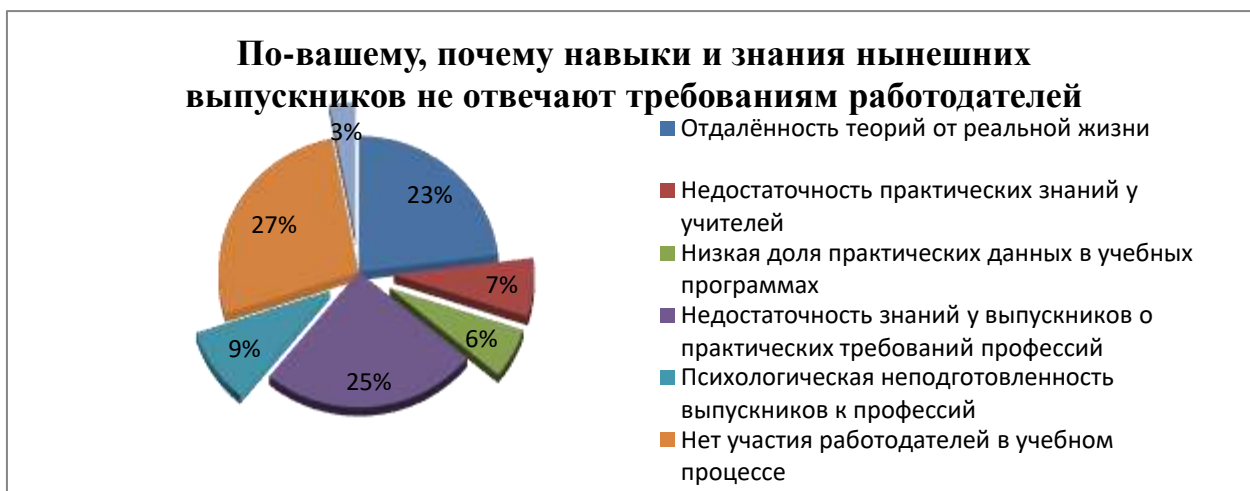
Рисунок-2. Причины не соответствия выпускников требованиям работодателей (взгляд работодателя)

По результатам этого опроса выяснилось, что будущие выпускники вузов не имеют теоретической и практической подготовки, выпускники не имеют практических навыков для будущей карьеры, а доля работодателей в образовательном процессе невысока. Выяснилось, что 9% выпускников придя на предприятие морально не готовы приступить к этому трудовому процессу.