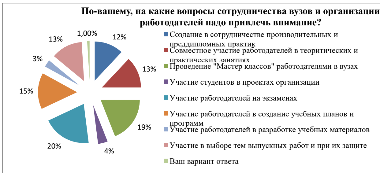
Рисунок 3. Результаты опроса, направленного на изучение методов взаимодействия вуза и работодателей.

По результатам анализа процесса гармонизации процесса формирования личностных и профессиональных качеств студентов, а также при изучении социологии образования определено, что современное обучение в высших образованиях должно гармонично развивать личностные и профессиональные качества студентов. Учебный процесс уделяет особое внимание развитию уникальных, целостных личностных качеств студентов, в которых студент стремится реализовать свой потенциал в полной мере, раскрывает свой внутренний потенциал, а затем готовится к экспериментам, тем самым формируя профессиональные навыки. А также определены эмпирическое обоснование состояние гармонизации профессиональных и личностных качеств у студентов, идентичность уровня их компетентности для будущей деятельности и устойчивость реального проявления профессиональных и личностных компетенций в соответствии с потребностями работодателей, преподавателей и студентов.