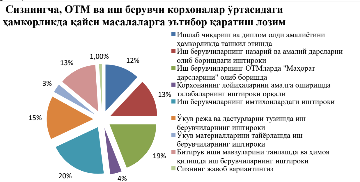
3-расм. Олий таълим муассасаси ва иш берувчи корхоналар ўртасидаги ҳамкорлик усулларини ўрганишга қаратилган сўров натижалари

Сўров натижасига кўра, корхона ва фармацевтика ташкилотларининг ишлаб чиқариш ва диплом олди амалиётини биргаликда ташкил этиши (12%) бўлажак мутахассисларни тайёрлашда ижобий натижалар беради. Шу билан бирга, улар иш берувчиларнинг имтиҳонларда иштирок этиши (20%) ва ўқув юртларида ўзларининг ташкилотлари тўғрисида маҳорат дарсларини (19%) ўтказиш талабаларда фанларни ўзлаштиришларига кўпроқ қизиқиш уйғотади, деб ҳисоблашган. Шунингдек, респондентлар (15%) талабалар учун ўқув дастурларини тузиш учун иш берувчилар тажрибали мутахассислардан фойдаланишлари тавсия этилади, деб ҳисоблашган (3.-расм).