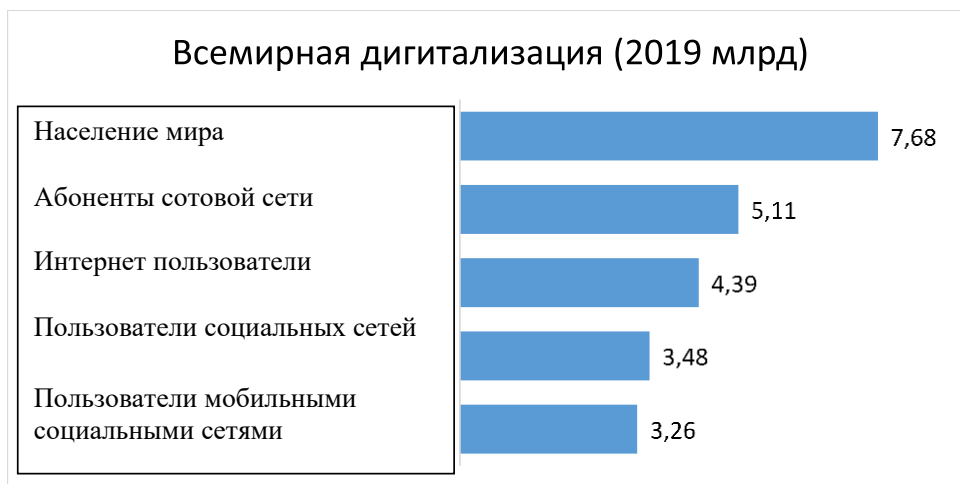
Рис 1. В ходе социологического исследования были изучены использование глобальные интернет системы 25 .

Согласно результатам исследования, социальные сети в Узбекистане имеют свои особенности. Это прежде всего процесс того, как молодые люди могут мобилизовать ресурсы для самостоятельного решения своих проблем в обществе. Это: 1) экономические ресурсы, которые включают показатели собственности, наличия средств и аналогичные показатели; 2) источник знаний и умений, который считается суммой знаний, умений; 3) социальный источник: а) ежедневное общение и поддержка (наличие друзей, постоянное общение с ними и их доверие), б) использование надежных социальных сетей, в) использование официальных сетей (членство в клубах и вечеринках); 4) культурный источник, то есть показатели досуга и культурных потребностей, условий для детей и молодежи (место жительства, информация родителей); 5) личный источник: достичь поставленной цели, улучшить свое материальное положение, повысить трудовую активность; 6) биологический ресурс, основанный на характеристиках молодого человека, которые увеличивают или уменьшают шансы на получение прибыли на рынке труда.