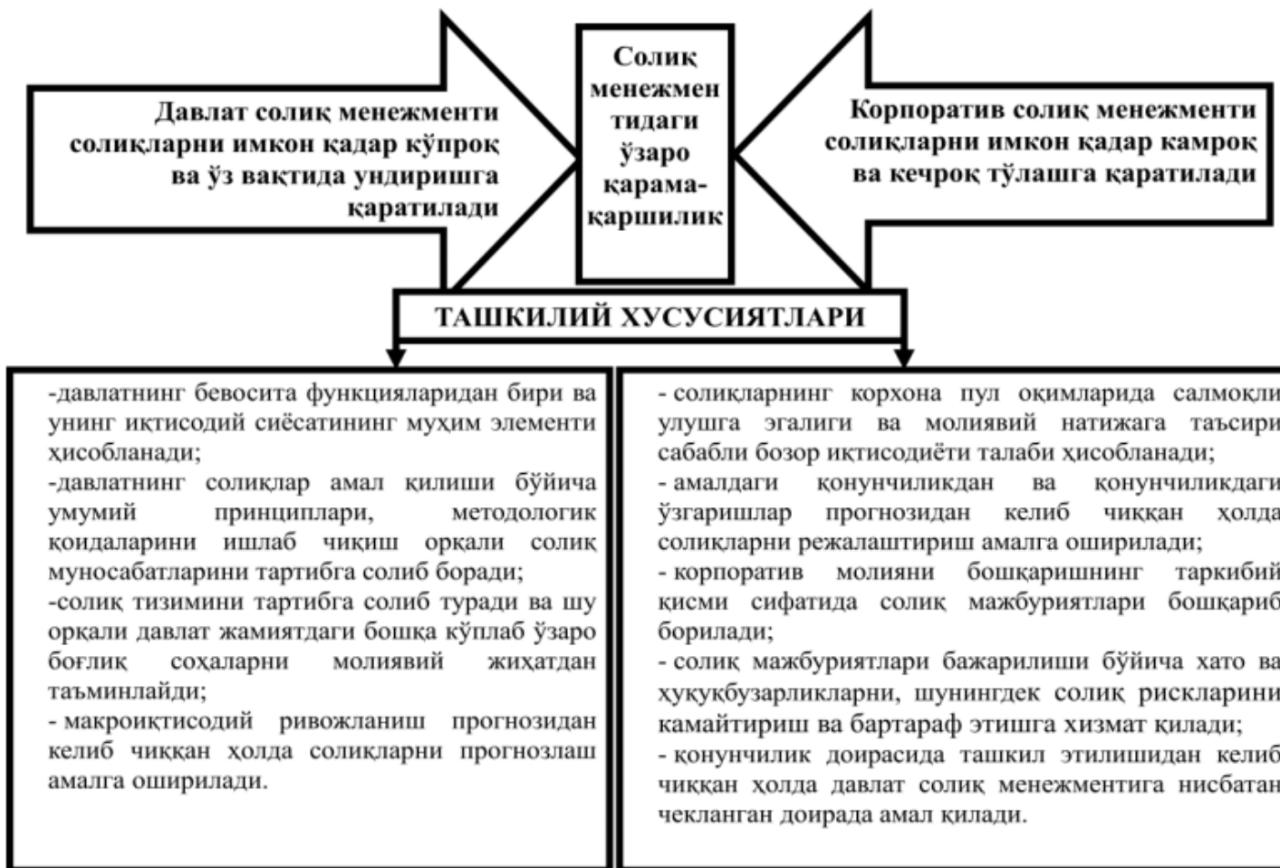
1-расм. Давлат солиқ менежменти ва корпоратив солиқ менежменти ташкилий хусусиятлари