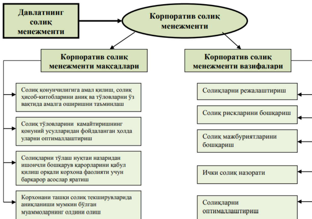
2-расм. Корпоратив солиқ менежменти асослари