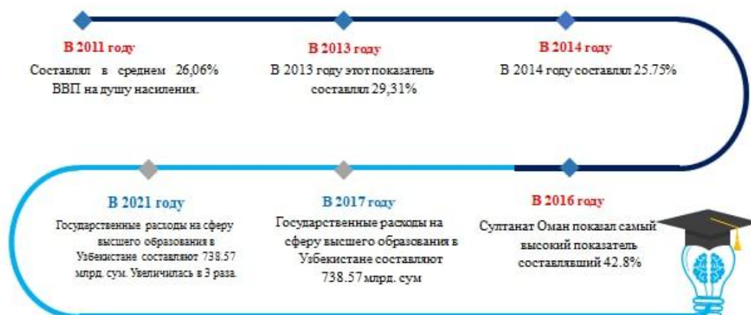
Рис-1. Расходы на одного студента в высшем образовании в мире 22

социально-экономических проблем в обществе. У неё также есть механизм саморазвития собственной системы в контексте совершенно новых рыночных отношений.