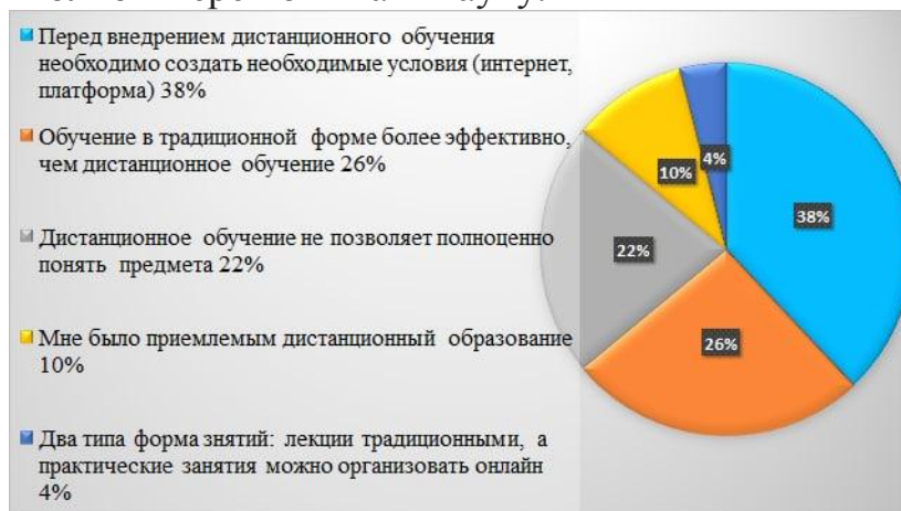
Рис-3. Мнения пользователей сети о дистанционном обучении (в процентах) 24

22,0% молодых людей считают, что дистанционное образование не позволяет им в полной мере понимать науку.