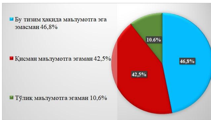
2-расм. Болонья кредит тизимидан хабардорлик даражаси 14

Болон кредит тизими ҳақида мамлакатимиздаги педагог ва ўқитувчилар, ёш мутахассислар, умуман олганда, кенг жамоатчилик яхши хабардор бўлиши керак. Респондентларнинг Болон кредит тизимидан хабардорлик даражаси ўрганилганда, уларнинг қарийб ярми (46,8%) маълумотга эга эмаслигини билдирган бўлса, 42,5% қисман, 10,6% тўлиқ маълумотга эгалигини таъкидлаган.