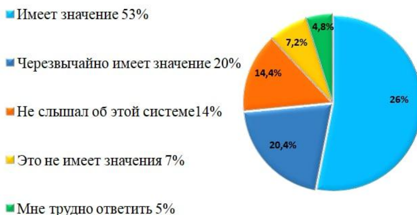
Рис-4. Оцените важность кредитной технологии ESTS (в процентах) 26

Основные преимущества кредитной технологии ECTS в организации учебного процесса можно объяснить следующим: условия выбора вуза для продолжения обучения за рубежом, полное раскрытие способностей студентов и высокие результаты обучения. В целом кредитная система поощряет студентов к самостоятельной работе. Выбор направления индивидуального обучения способствует обеспечению академической свободы бакалавров, магистров и докторантов. Респонденты также оценили важность кредитной технологии ECTS для оценки процесса образования и результатов обучения.