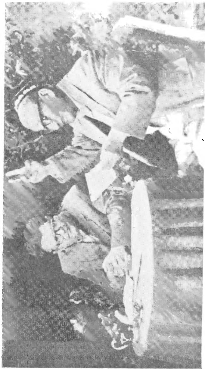
Гафур Гулом ва Шайхзода, 1963 йил.