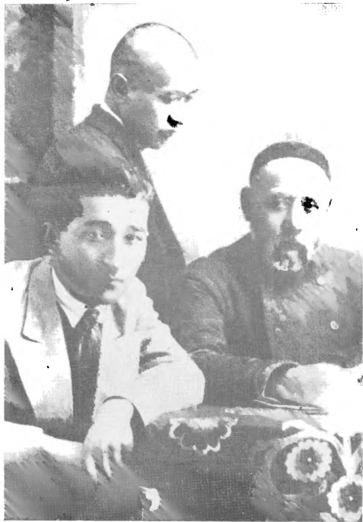
Гафур Гулом, А. Деҳотий, С. Айнӣ, 1935 йил, Тошкент.