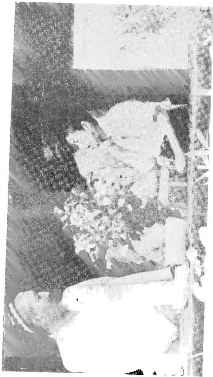
Гафур Гулом Н. Островский номидаги пионерлар саройида. 1953 йил, Тошкент.