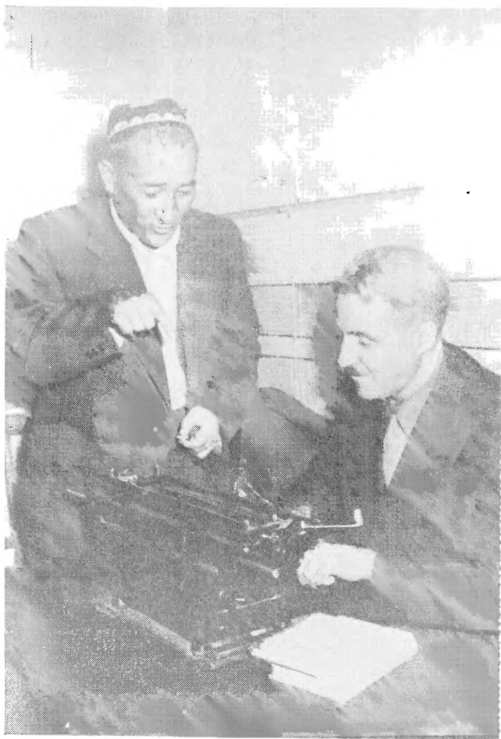
Ғафур Ғулом ва К. Симонов. 1958 йил, Тошкент.