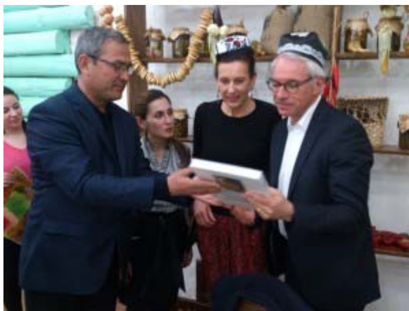
“O‘zbekturizm” xalqaro sayyohlik yarmarkasida