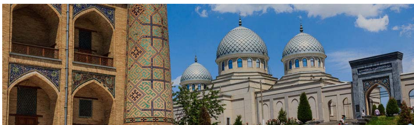
ТОШКЕНТ ХАЛҚАРО ТУРИЗМ ЯРМАРКАСИ “ТУРИЗМ БУЮК ИПАК ЙЎЛИДА”