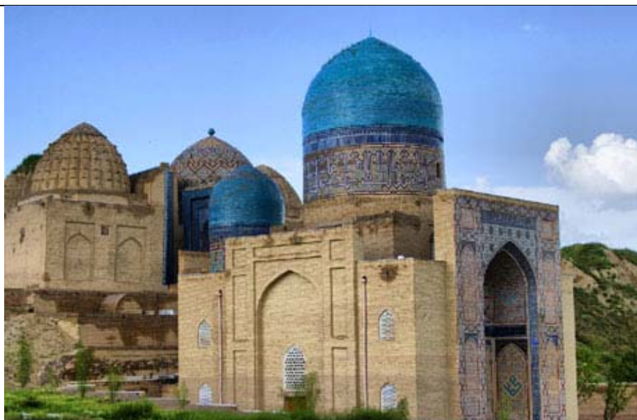
Шохизинда мемориал комплекси

“ДАМ ОЛИШ ДУНЁСИ-2015” ХАЛҚАРО ЎЗБЕКИСТОН САЙЁҲЛИК КЎРГАЗМАСИДА САМАРҚАНДНИНГ САЙЁҲЛИК ФИРМАЛАРИ ВА МЕҲМОНХОНАЛАРИ ВАКИЛЛАРИ ФАОЛ ИШТИРОКИ