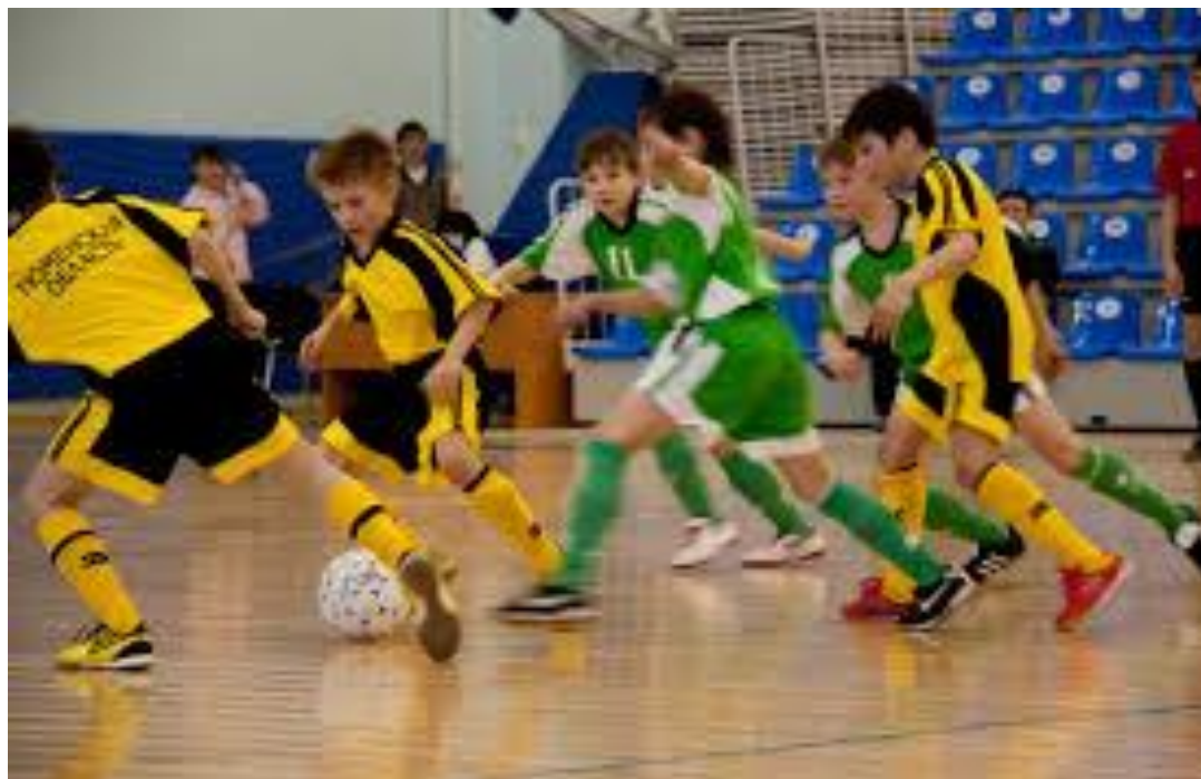
Yosh bolalar musoboqasi