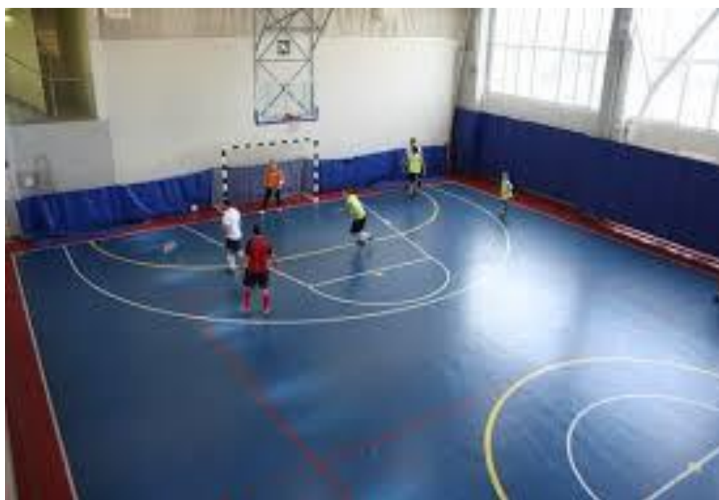
Kichik futbol o'yini