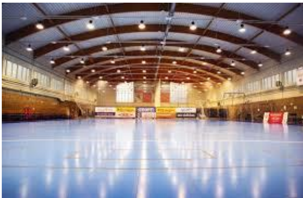
Kichik futbol maydoni