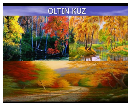
3-расм. Мавзуга оид мультимедиа воситасидан лавҳа