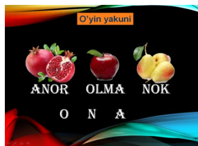
2-расм. Мавзуга оид мультимедиа воситасидан лавҳа

Мультимедиавий слайд намоиш этилганда слайд пастида дастлаб О – бош ҳарфи фазода ҳаракатланиб (анимация), сўнгра N – бош ҳарфи анимация асосида келиб жойлашади, ниҳоят A – бош ҳарфи юқоридагидек эффект билан келиб жойлашади ва ниҳоят ONA – сўзи ёзилади.