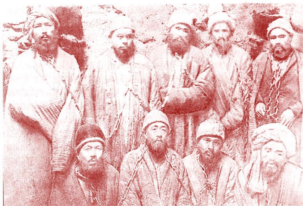
Qo'zg'olon qatnsihchilari hibsd.