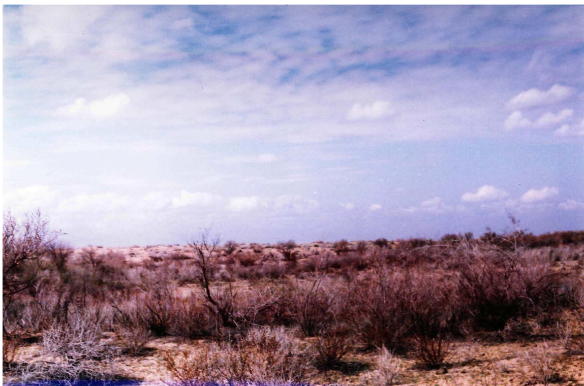
6-su'wret. Qızılqum sho'li.

ha'm Sultanwa'yistaw (uzunlig'ı 40 km, eni ortasha 10-15 km, en' biyik jeri 485 m) qaldıq to'beli'qleri buzıp turadı. Qaldıq to'beli'qler ha'm olarg'a tutas eski delta tegisli'qlerinin' bo'lekleri ekollogiyalıq sharayatları boyınsha ha'r tu'rli bolsa da, qorshag'an ortalıq sharayatları ha'm olardın' ta'biyatına texnogen ta'sirler tu'ri boyınsha turaqlılıg'ı olardı birlestirip turadı. Bul aymaqlardag'ı o'simli'qler qaplamının' jag'dayı jil sayın ku'sheyip baratırğ'an tikkkeley antropogen ta'sirlerge baylanıslı. Bul jerlerde jiyi jaylasqan awıllardın' a'tirapında insannın' kerı ta'siri ayırıqsha ko'zge taslanadı.