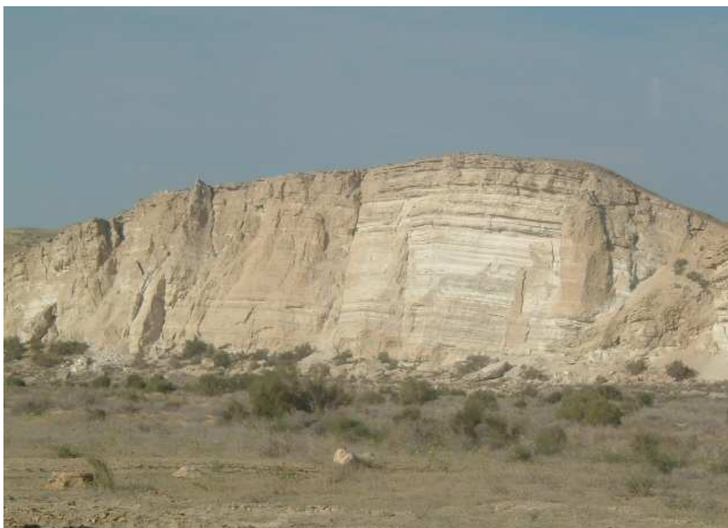
5-su'wret. U'stirt platosı.

ja'ne 1ssı boladı. Aymaqta jawın-shashın og'ana za boladı — ortasha jıllıq mug'darı 100 mm a'tirapında, onın' ko'pshili'q bo'legi ba'ha'r ma'wsimine tuwra keledi (mart-aprel ayları). A'dette turaqlı qar qatlamı qa'liplespeydi. Suw ta'miynatının' birden-bir deregi 6-20 m teren'li'qte jaylasqan jer astı suwları bolıp esaplanadı. O'simli'q qaplamının' tarqalıwı topıraq tu'rine baylanıslı. Ma'selen, juwsanlı-boyalıshlı assotsiatsiyalar a'dette shorlanbag'an jerlerde o'sedi, biyurgunler – kebir jerlerde, ku'yrewik, biyurgun menen juwsan – kem shorlang'an jerlerde, al seksewil – onsha rawajlanbag'an mayda dizbekli qumlarda o'sedi.