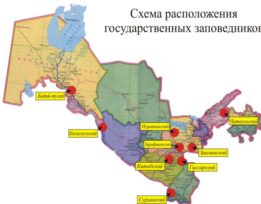
Схема расположения государственных заповедников