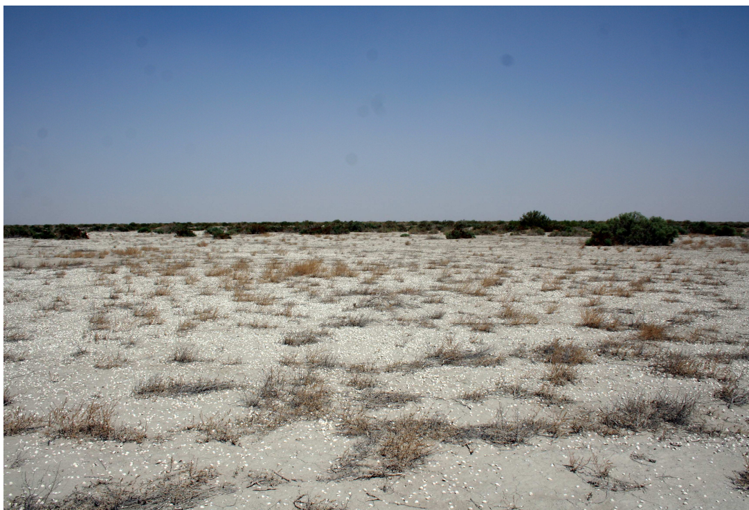
7-su'wret. Aralqum sho'li.

jo'nsiz ısrab etiliwi na'tiyjesinde Aral ten'izinin' qurıp qalıwı sebepli payda bolg'an. Ten'izdin' qurıp qalg'an bo'legi U'lken Aral (Shıg'ıs basseyn) suw qa'ddi ko'leminin' (akvatoriyanın') qısqarıp barıwı esabınan jedel ken'eyip barmaqta. Bu'gingi ku'nge kelip, ha'r qıylı mag'lıwmatlar boyınsha, O'zbekstan aymag'ındag'ı Araldın' qurıp qalg'an bo'liminin' maydanı 4 mln. gektardan asıp ketken.