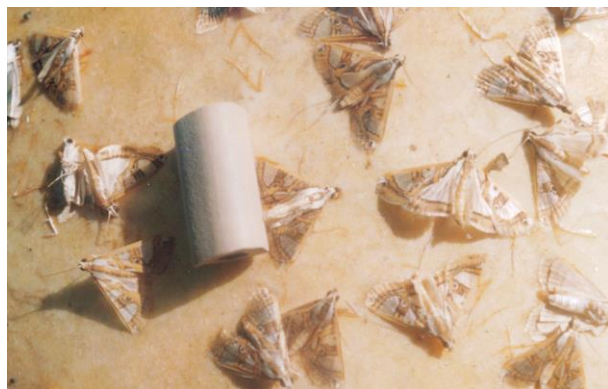
4-расм. Турли шаклдаги шимдирган ЖФ нинг ТП ни жалб этишига таъсири