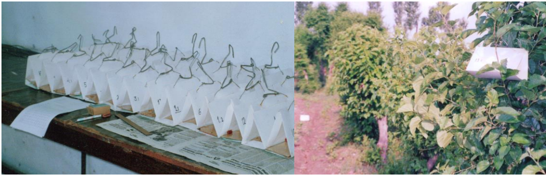
3-расм. ТП нинг ФТ ларини тайёрлаш (а) ва тутларга илиб жойлаштириш (б).

Ҳар назоратдаги капалакларнинг зичлиги (кўп – камлиги) ҳамда назорат қилинган муддат мобайнида йиғилган жами сони бир-биридан унча катта фарқ қилмади.