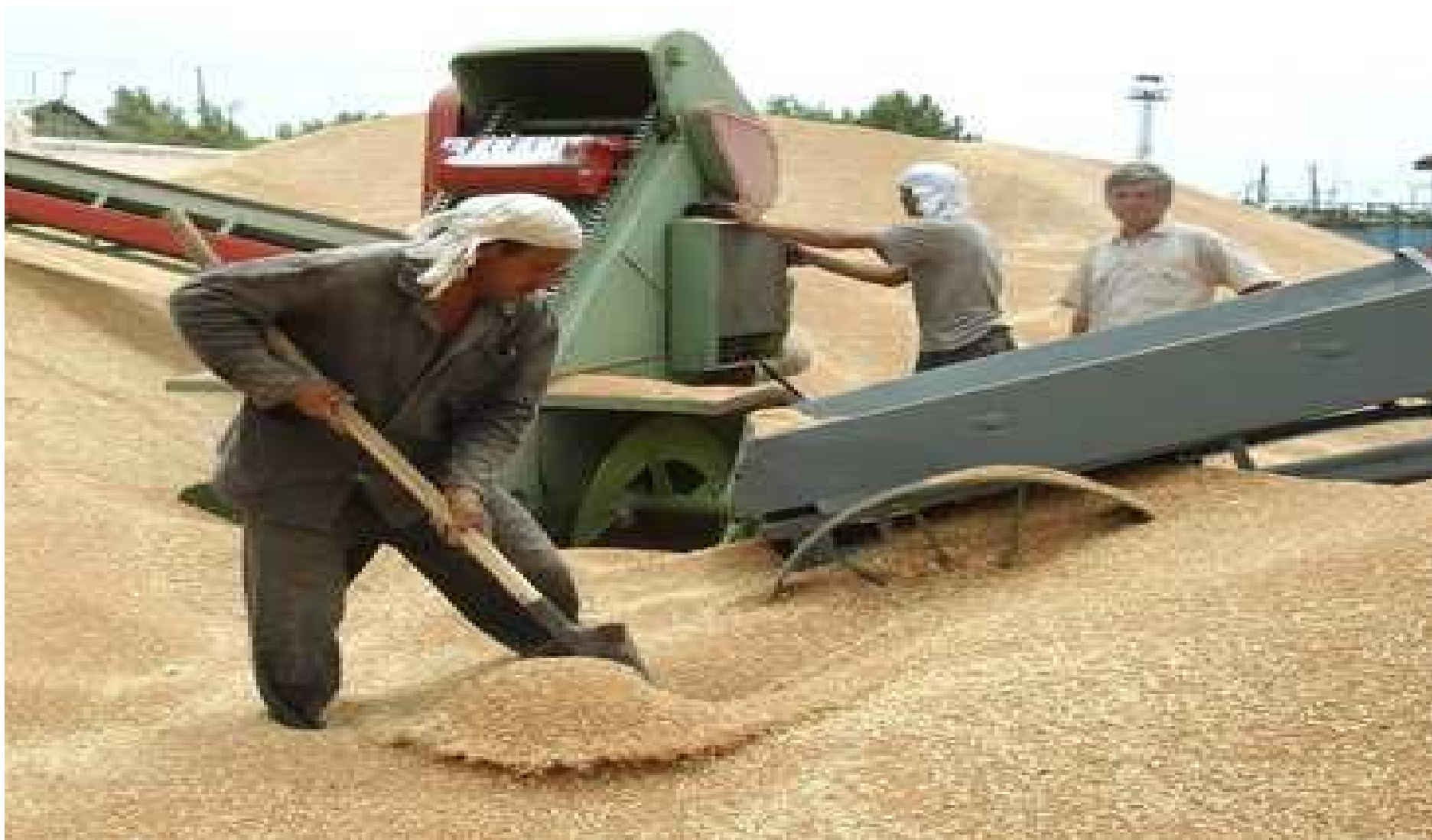
2.1.1- расм. Буғдой хосилини йиғиштириш жараёни