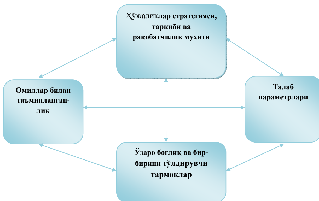
1.1.1-расм. Мамлактнинг рақобат жиҳатдан усунлигини ташкил этувчи унсурлар (М.Портернинг рақобат устунликлари ромби).

2. Мамлакатда ишлаб чиқарилаётган маҳсулотларга ички ва ташқи бозорлардаги талабнинг ҳажми, таркиби ва уларнинг ўзгариши миллий иқтисодиётнинг рақобатдошлигига бевосита таъсир кўрсатади. Бу маҳсулотларга талаб ҳажмининг ошиши миллий иқтисодиётнинг рақобатдошлигини оширади ва аксинча.