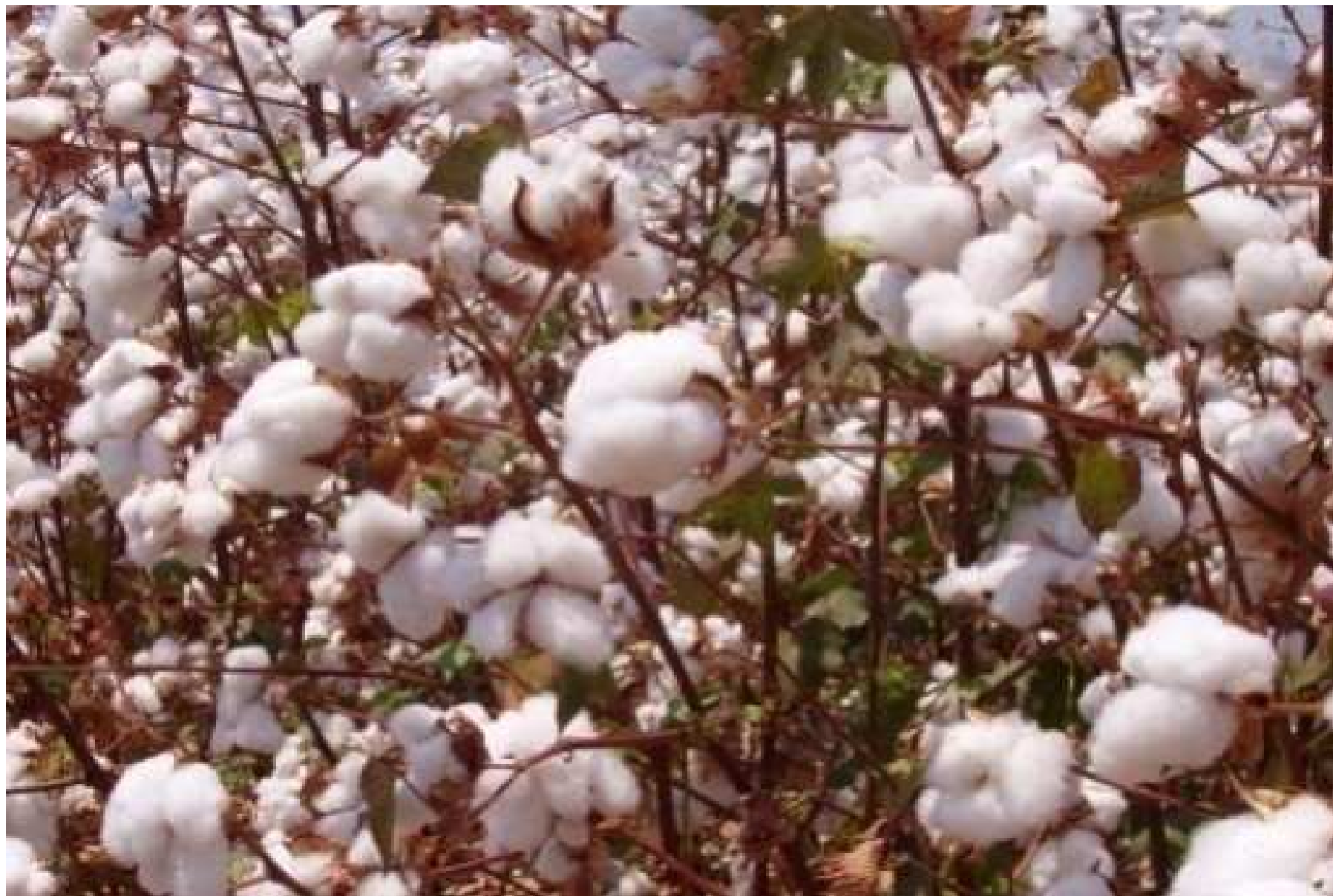
2.2.1-расм. Пахта далаларида хосил етилган даври