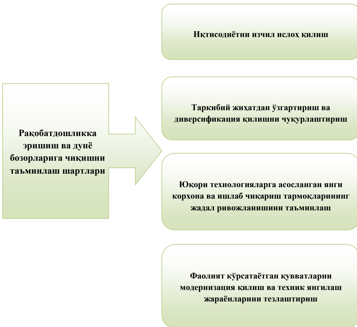
3.1.1-расм. Мамлакатимиз иқтисодиётининг рақобатдошлигини таъминлаш шартлари 10 .

Сифати ва нархи бўйича жаҳон бозорида рақобатдош бўлган маҳсулотлар ишлаб чиқариш ҳажмини кенгайтириш ва янги маҳсулот турларини ўзлаштиришга катта миқдордаги инвестицияларни жалб этиш ҳамда ўзлаштириш орқалигина эришилади.