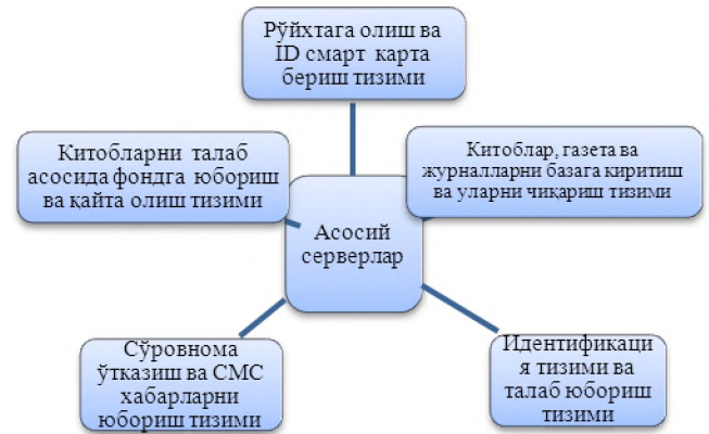
Расм. 1. Smart кутубхона модуллари схемаси.

ахборот ресурсларини олиш имкони яратилади. Тақдимотдан тортиб, дарсликларгача, курс ишидан тортиб, докторлик диссертацияларигача фойдаланувчилар саралаб олиш имконини бериши мумкин. Қуйида Smart кутубхона ташкил қилиш модели ишлаб чиқилган бўлиб, улар бир неча модулларга тақсимланади. (1-расм)