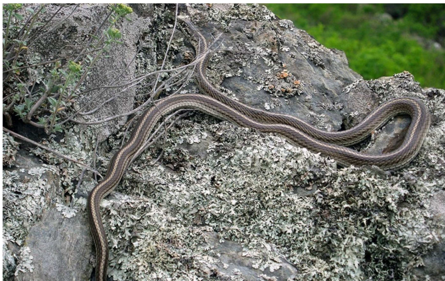
20- súwret. Nagıslı poloz

qara gúngirt yamasa qara reńdegi daqlar quyriq bólimine shekem ornalasadı. Denesiniń qaptal tárepinde bir sızılǵan gúngirt sızıq, quyırıqqa shekem dawam etedi (20-súwret).