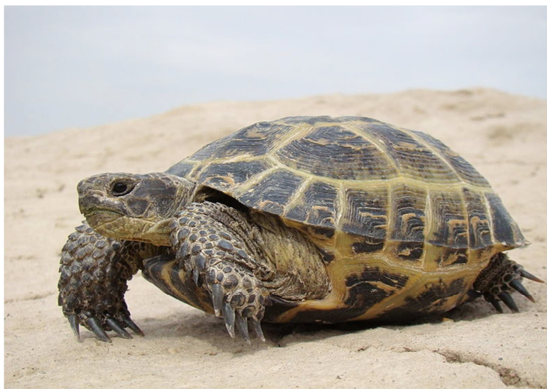
1- súwret. Orta aziya dala tasbaqası— Testudo horsfieldii

Sawiti júdá biyik emes, dóńgelek sanlaw-qońır reńde, jayılǵan qara daqlan bar. Denesiniń uzınlıǵı 20 sm den aspaydı (1- súwret). Uǵashisi erkeginen úlken. Aldıngı ayaǵı 4 barmaqlı. Kóbinese sahralarda hám qumli taqirlarda gezlesedi. Kúndiz kóbirek hárekette boladı. Efemer, kóp jilliq ósimliklerdiń shaqalarında , jańa shigip kiyatırǵan biyday, paxta, qawın, ǵarbız h t.b.lar menen awqatlanadı.