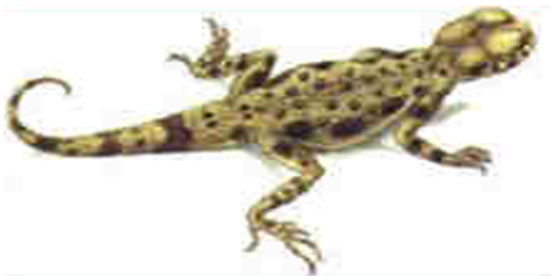
6-súwret. Xentaun domalaq baslı

Ortasha úlkenlikte, quyırıqsız, dene uzunlıǵı 5-8,3 sm. Uliwma dene reńi arqa tárepi san-sur reńde, moyın gewdeniń eki qaptal tárepinde úlken tórt kók yamasa qońır daqlar ornalasadi. Quyriq hám ayaq bóliminiń sirtqi jaǵında kesesine oralǵan qara daqlar bolip, quyırıqtıń ushına deyin baradi. Quyırǵı jalpaqlaw. Qarın tárepi aq reńde.