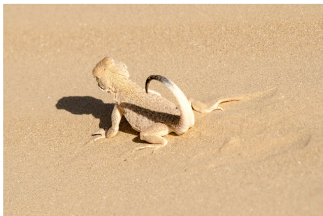
7-súwret. Qum domalaq baslı

Qum domalaq baslilar Qubla Qazaqstan hám Orayliq Aziyaniń qumli jerlerinde, kishkentay, suliw qum domalaq baslilardi ushiratiwǵa boldi. Dene uzunlıǵı, quyırıqsız 4,2 sm, al quyırǵı menen 8,0 sm den aspaydi. Denesi jıńishke, arqa qabirshaqları mayda hám qinna jaylasqan. Bas hám moyin bólimi qabirshaqlan úlkenirek hám ótkir ushları bar. Quyırǵı jalpaq, qum reńli san, tıǵız jaylasqan, qońır hám aqshil toshkaları menen, arqasında-da, jawrın ústinde, qum domalaq baslilarda qızǵısh yamasa liliya reńde daq boladi (-súwret).