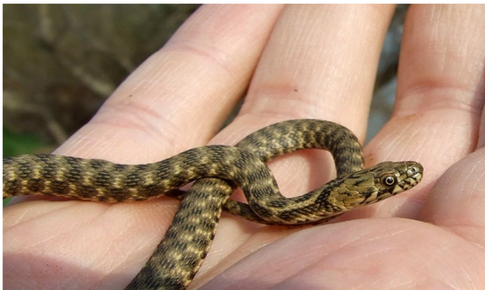
16— súwret. Uj jılan máeginen shıqqan balası

Jılan máyekleri qurğaqliqtan tez kewip ketedi,sonliqtan jılanlar máyegin barqulla ıgalli jerlerge tuwadı hám saqlaydı.