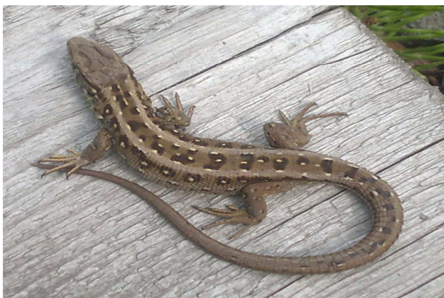
11 -súwret. Sıydam kesirtke.

Sızıqlı kesirtke Oraylıq Aziyada jıńıshkelew, kishkene, uzın sızıqları menen sızıqlı yashurka jasaydı. Quyriqsız, dene uzınlıǵı 5,5 sm, awırlıǵı 2,5-3,0 g. Mańlay bóliminiń aldınǵı jagındaǵı sawıttan uzınına tartılǵan kishkene nawa sızıqlar bar (11-súwret).