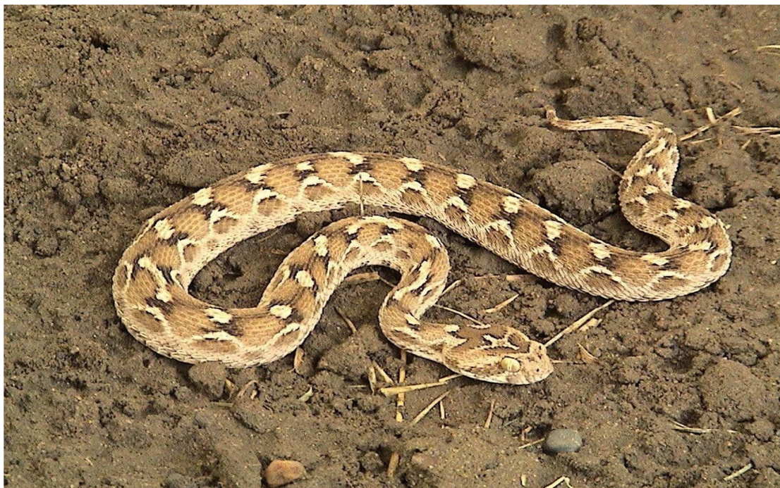
22-súwret. Qum efasi

Qum efasi. Qum efasınıń dene uzmlıgı orttasha 50-60 sm geyde 75 sm ge shekem baradı. Bas bólimi mayda uzınsha qabırshaqlan menen qaplangan. Arqa qabırshaqları júdá dúńkiyip turadı. Denesiniń qaptal táreplerinde 4-5 qatardan turatugı n mayda hám qısqa qabırshaqlar bolıp tómenge qarağan. Arqa bóliminiń reńi sur-qum tárizli, al qaptal tárepindegi qabırshaqlardıń reńi qaralaw. Arqa hám qaptal qabırğalarımń arasında iyreklengen aq reńde jol ornalasadı. Arqa bóliminde dóńgelek tárizli daqlar, al bas bóliminde uship baratırğan qus formasındağı kórinis boladı. Tiykannan órkeshlengen qum aralarında, seksewil aralarında, shópli qum taqırları, t.b. jerlerde ushırasadı. Qısqı uyqıdan fevraldıń aqırlarında mart aylarında oyanadı (22-súwret).