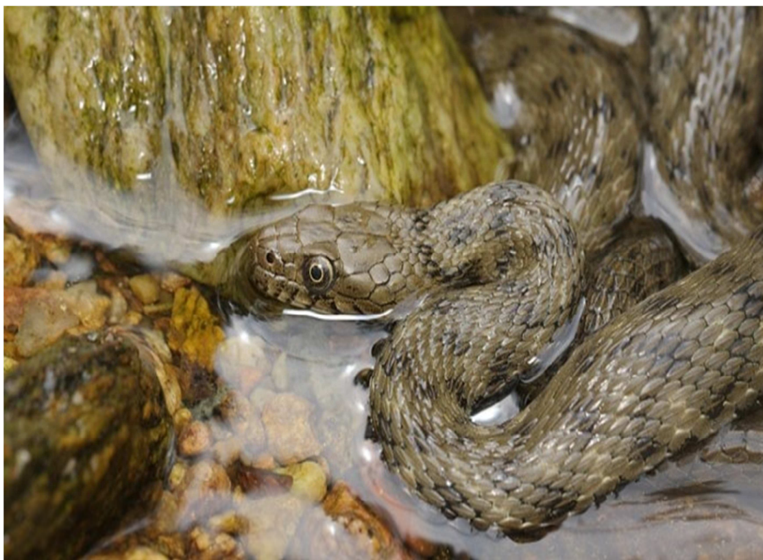
17- súwret. Suw jılanı

qıylı úlkenlikte qara daqlar aralasqan. Geyde tek bir reńde qara túride gezlesiwı múmkin (17-súwret).