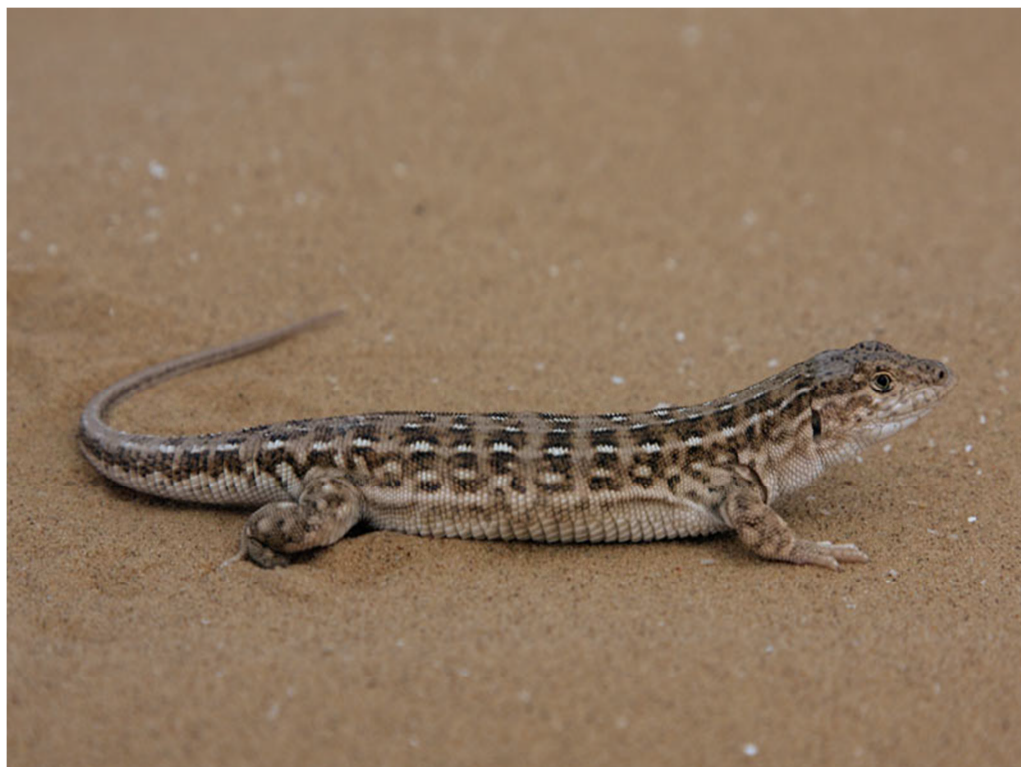
12-súwret. Túrli reńdegi kesirtke

Orayliq Aziya Respublikasiniń barlıq jerlerinde tarqalǵan. Túrlishe reńdegi bul kesirtke hár qıylı landshaftlarda, shólistanliq, yarım shólistanliq hátteki az sandaǵı ósimlikler rawajlangan tasli jerlerde de jasadı. Bos jerlerden úngir qaza aladı, bul úngir uyanıń tereńligi 20 sm ge shekem baradı. Kópshilik jaǵdaylarda tishqanlardıń basqa da haywanlardıń úngirlerinde jasadı. Qısqı uyqıdan báhár aylarında fevral ayınıń aqın mart ayınıń baslarında oyanadı, al qısqı uyqıǵa oktyabr, noyabr aylarında ketedi. Jazda azanǵı hám kesliki waqlan aktivligi kúshli. Awqat zatlan bolip quminsqa, qońızaq shekshek, shıbin hám góbelek qurtlan t.b. esaplanadı. Aprel aylarman baslap máyek tuwa baslaydı hám bir máwsimde eki mártebe máyek saladı. Uliwma bir máwsimde 3-12 ge shekem máyek tuwadı. Máyekleriniń uzınlıǵı 1,0-1,6 sm. Máyekten iyun, iyul aylarında balalan shıǵa baslaydı. Máyekten shıqqan balalanm' uzmlıǵı 2,8-3,5 sm.