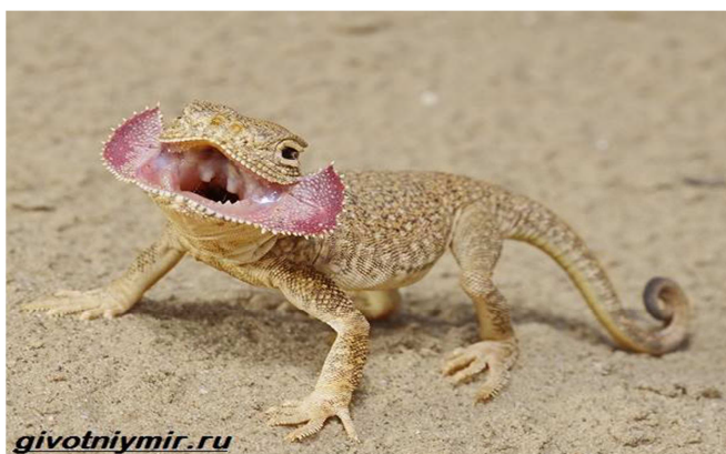
8-súwret. salpañqulaqlı dóńgelek baslı

Tarqalğan jerleri Astraxan oblasti, Kavkaz, Orayliq Aziya. Bas bólimi, gewde hám quyriq bólimi jalpaq, awiz bóliminde qulaqqa uqsagan teri qatlami boladi. Denesi sirtinan qirli qabirshaqlar menen jabilğan. Deneniń uliwma reńine sur tús berilgen. Usi reńde denede quramali qara tústegi quyqish-quyqish súwretler, siziqlar hám toshkalar menen tolğan. Qarın yamasa astingı tárepiniń reńi sút reńli bolip, kókirek bóliminde qara mayda toshkalar boladi. Quyriqiniń ushi qara. Báharde uyqidan fevral, mart ayları ishinde oyanadi, al qisqi uyqığa oktyabr aylarında ketedi. Kúndiz de aktiv. Nasekomalar, quminsqalar, qońizaqlar, termitler, keneler tađi basqalar menen awqatlanadi. Jasil shópler japırađi, geyde mayda kesirtkelerdide uslap jeydi. Birinshi tuwiwi may ayiniń aqiri, ekinshisi iyunniń aqin, iyuldiń basi, hár tuwğanında 2-6 máyek boladi hám balalan máyekten iyul ayiniń aqinna shıgadi. Eki jasina shıqqanda er jetedi.