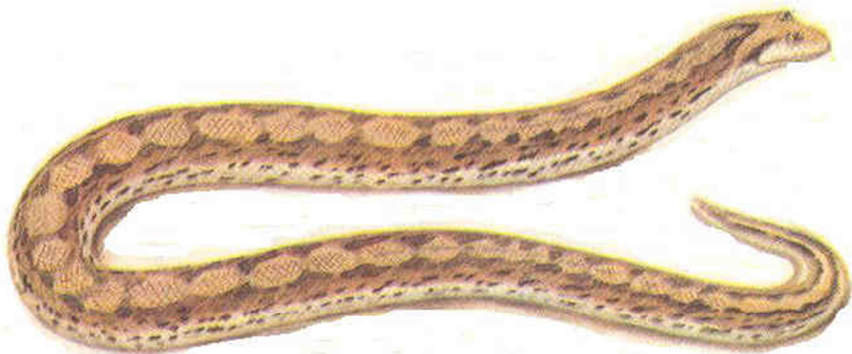
14-súwret. Qum udavchigi

ketedi. Kóz aralarında 7-9 dan formasiz qabirshaqlar bolsa, munn aralarında 2-3 úlken qabirshaqlar boladı. Kózleri qaptalğa qaratilğan hám átirapında 10-14 mayda qabirshaqlar bar. Denesin mayda, qalıń 43-49 ға jetetugı n kese qabirshaqlar qaplağan. Quyriq qabirshagı jumsaq. Arqa bóliminde uzinina ketken ashiq sanlaw qońir daqlar bar. Qumniń reńine uqsas bolip keledi. Omirawmiń asti qońir yamasa qara dagı bar bujirtpaq boladı. Jasaw jağdayına baylamsh qara túride gezlesedi (14-súwret).