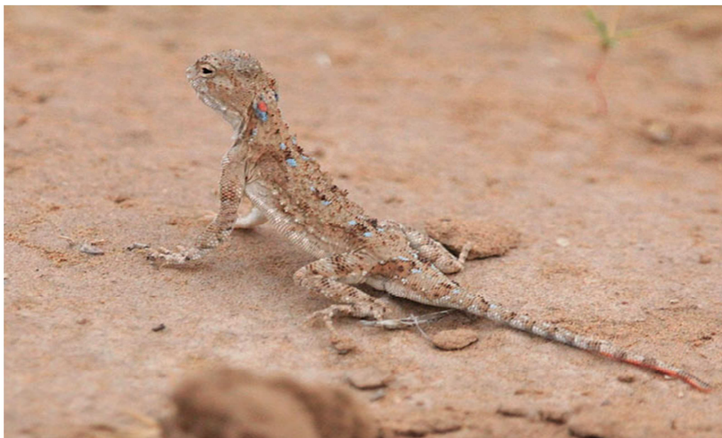
5 -súwret. Taqir domalaq baslı.

Taqir domalaq baslilar Onsha úlken emes, quyriqsız dene uzunlıǵı 6-6,5 sm, awirlıǵı -10-12 gr. Geypara úlkenleriniń quyriǵı menen uzunlıǵı 25 sm ge jetedi. Urganisi erkeginen úlken (-súwret).