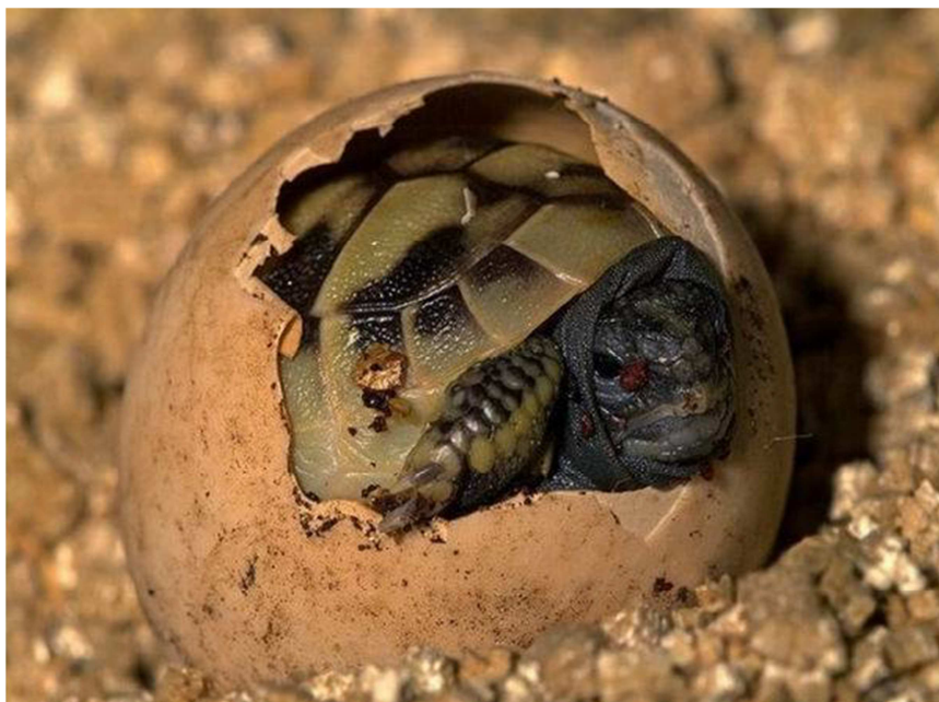
2- súwret. Orta aziya dala tasbaqasi balsiniñ máyekten shigiw paytı.

Qumlardagi efemer ósimlikleri jazda quwragannan keyin, tasbaqalar iyun ayinan baslap uyqiga ketedi. Uyalariniñ yamasa inleriniñ uzunligi 1 metrden 2 metrge shekem baradi. Jazgi uyqi hawa rayina baylanisli geyde qisqa ótip ketedi. Eger gúz aylari salqin, jawinli bolsa, geyparalari uyqidan oyanip, awqatqa ótiwi múmkín. Báharde fevral-mart aylarinda uyqidan oyanadi hám bir-eki kúnnen keyin qaship ketedi. Aprelden iyungá shekem 2-3 márte 2den 5ke shekem aq qatti hák penen qaplangan máyek tuwadi. Máyeginiñ awirligi 29-30g, uzunligi 40-57mm. Máyektiñ inkubatsiya waqitti 80-110 kún. Avgust-sentyabr aylarinda máyekten shiqqan tasbaqalar júdá kishkentay 30-50 mm uzunliqta boladi.