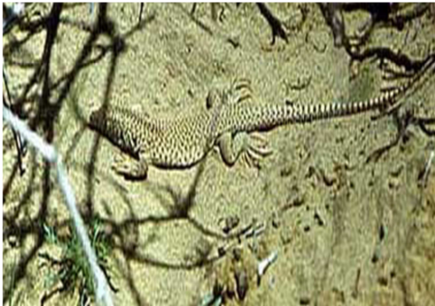
13-súwret. Torlı gesirtge

depte aytadı. Kesirtkeniń arqa tárepi sur, jasil yamasa qońir túr aralasqan. Uliwma qaraǵanda deneniń arqa tárepi kóp sandaǵı torlı daqlardan turadı. Al, quyriq bóliminde qara reńdegi dóńgelekler bar. Qarin bólimi sanlaw geyde aqshıl (13-súwret).