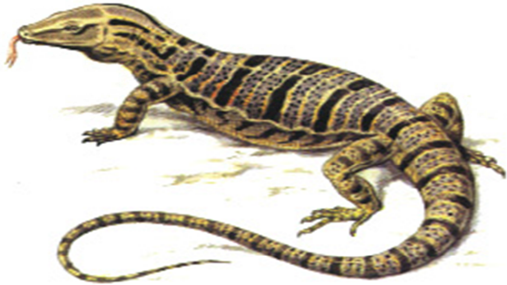
9 -Súwret. Qum yamasa sur eshkiemer

Onda kóp sandaǵı qara noqatlar hám daqlar bar. Moyın bóliminde 2-3 qońır uzınına tartılǵan jol, al arqasında usınday reńde 5-8 keń, kesesine tartılǵan jolaq jol, quynq bóliminde de boladı. Qum yamasa sur eshkiemer Arqa Afrikada, Aziyada Pakistanda hám Oraylıq Aziyada tarqalǵan Qum hám yanm qumlı dalańlıqlarda sonıń ishinde taqirliqta, boz jerlerde, ılaylı, kóshpeli qumlarda da gezlesedi. Bul dárya kanal jaǵalawlarında, góne* jaylar hám jaylawlarda, egilmey qalǵan atızlarda da ushırasadı. Uliwma barlıq jerlerde de sonıń ishinde Qaraqalpaqstan aymaǵında az sanda ushırasadı. Dala tishqanlannıń ásirese qum tishqanı, suslik, tasbaqa inlerin ózine úlkeytip qazıp aladı. Inniń uzınlıǵı 2-2,5 m. Innen júdá uzaqlap kete almaydı. Suwda júze aladı, tez juwıra aladı, aǵashlarǵa órmeleydı. Awqat zatlan ushin mayda haywanatlar, úy tishqanı, qum tishqanlan, kirpitiken hám gójekler, jılanlar, agamalar, kesirtkeler, nasekomalar h.t.b. uslap jeydı. Uyasınan quslardı da tutıp jeydı. Barlıq is-háreketi kúndiz boladı. Báhárgi uyqıdan marttıń aqın apreldiń basında oyanadı, al gúzde oktyabr aylannan baslap uyqıǵa ketedi. 3 jasqa shıqqanda er jetedi