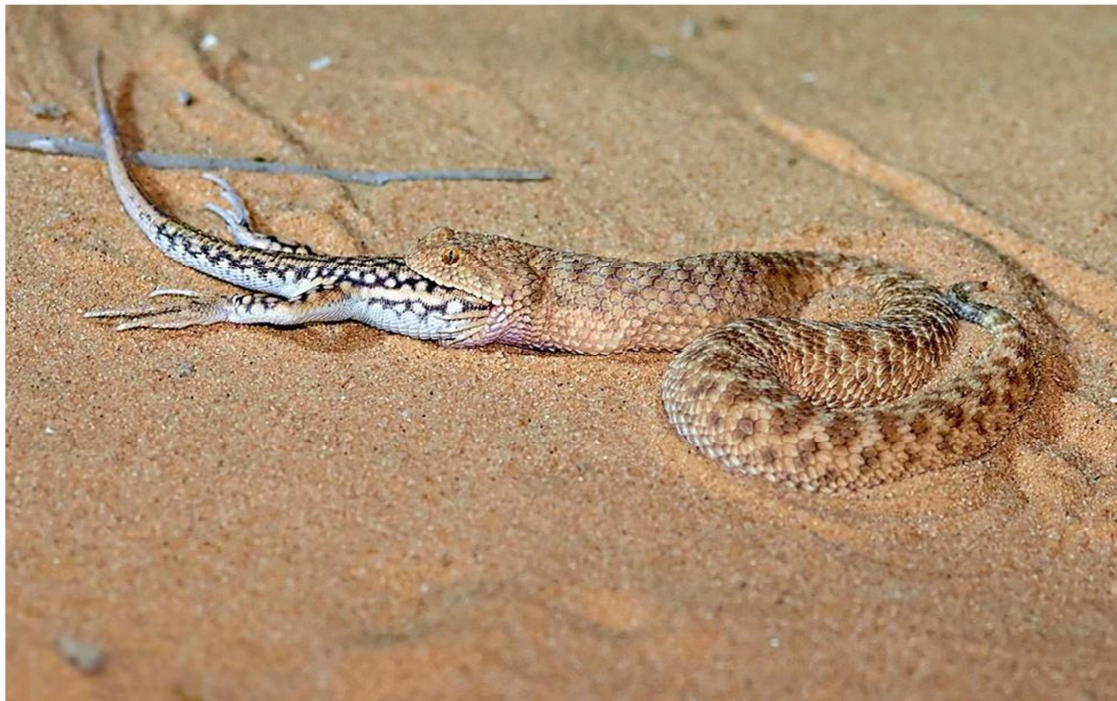
23-súwret. Qum efası gesirtkeni jutpaqta.

May ayiniń aqırlarina shekem kúndiz aktivligi kúshli, al iyun ayinan baslap, yaǵniy kún isigannan baslap aktivligi túnde kúshli boladı. Gúzde kóbirek waqtin kúndiz awqat izlew menen ótkeredi. Al, qısqı uyqıǵa oktyabr aylannan baslap ketedi. Bunda tishqanlardıń inleri,t.b.qolayli úngirlerge kirip uyqıǵa ketedi.