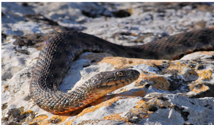
15 - súwret. Suw jılan – Uj

shlaw) ornalasadı. Daqlardıń formasi yarım ayǵa uqsap ketedi. Geyde geypara túrlerinde bunday daqlar bolmaydı. Denesiniń arqa tárepiniń reńi qara aqshil yamasa qońır qara bolip, al qarın bólimi aqshil, biraqta qann daqlan kóp bolǵanlıqtan, qann bóliminiń aqshilligı amq bilinbey qaladı. Qublate jasaytuǵı n túrleriniń reńi jasil-oliv yamasa qońırlaw-olivdey reńge iye boladı. Al, arqasınan uzınına eki hám bas bóliminen quyngı na shekem aq sızıq ótedi (15-súwret