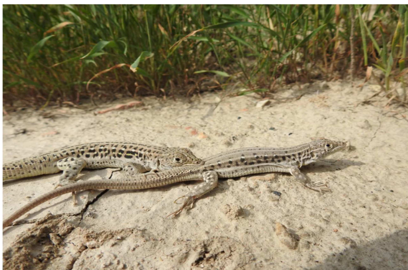
10 -súwret. Shaqqa kesirtkeler

Shaqqa kesirtke Forması suliw, uzin deneli, quyırığı menen 20 sm ge shekem baradı, al quyriqsız 8,5-10,5 sm. awirligi 6-7 g. Uzin quyırqlı, jas shaqqa yashurkalardıń denesinde úsh teń bólingen qara qońır sızıq sızılǵan. Eresek yashurkalarda denesiniń reńi sur, qum tárizli yamasa oliva-sur reńli, qara-qońır reńdegi sızıq bólinip-bólinip, formasız, óz aldına hár qıylı úlkenliktegi daqlarǵa aylanadı (10-súwret)