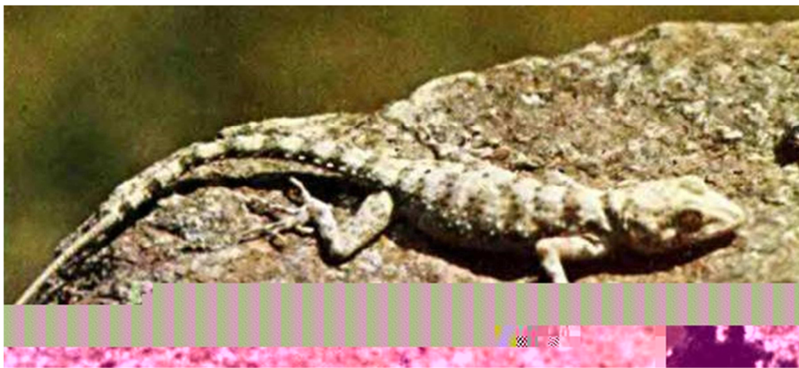
3 -súwret. Túrkistan gekkoni

Túrkistan gekkoni Bul gekkon kishkentay bolip, dene uzunlıǵı (quyrıǵın esaplamaǵanda)7,5sm den aspaydı. Bas bólimi júdá jalpaq, sonıń menen birge kókirek bólimi de jalpaqlaw bolip keledi.