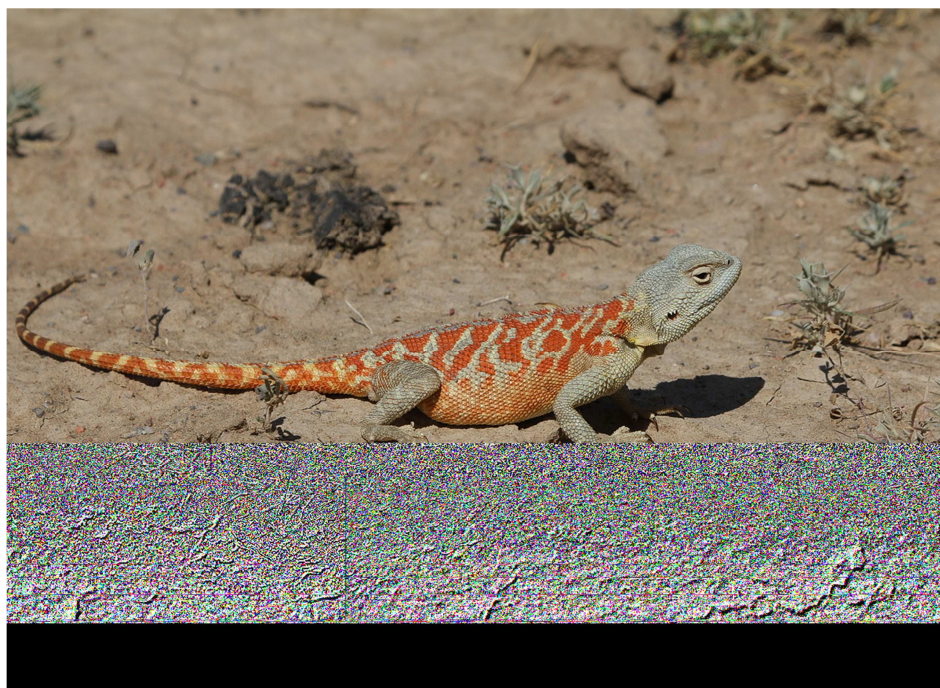
4- súwret. Dala agaması

Dala agaması. Qumlu hám keń dalańlıqlarda jasaytuğın túr. Orta úlkenlikte, denesiniń uzınlığı quyırğı menen 30 sm ge deyin baradi, awırlığı 35 grammğa jetedi. Erkegi, urgashisınan úlken. Basi úlken hám júrek formağa iye. Kókirek bólimi jalpaq. Eresek agamaniń dene túri sur yamasa san-sur túrde, al erjetiwı menen erkeklerindeki qara daqlar kete baslaydi yamasa joq bolip ketedi. Denesin qabırshaq qaplağan, biraq qaptal hám qarın qabırshaqları arqa qabırshağınan maydalaw. Bularınıń awziniń shetinde teri qatlami boladi, bul teri qabat jayilip, awız quwisin keńeytedi. Quyırıq bólimindeki kese dóńgelek kem-kemnen quyırıq ushına qaray jıńishkelenedi hám qabırshaqları qıysıqlaw ornalasadi. Sirtqi qulağı bilinip turadi. Tirnaqları dóńgelek hám keyingi ayaqtağı 4 barmağı