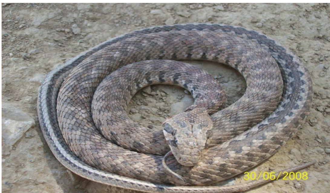
18- súwret. Hár qiyli reńdegi yaki shubar poloz - Raznotsvetnyy poloz.

Ózbekstan, Túrkménstan, Tájikstan, Qırqızstan hám Qazaqstannń Qubla rayonlarında gezlesedi. Hár qiyli jerlerde ushirasadı. Shóp ósip turǵan taw eteklerinde, sazli dalalarda yamasa yarim shólistanhqlarda mayda qum bólekshelerinde, dárya jaǵalarında, jaylawda t.b. jerlerde jasaydı. Taw janqlan bolmasa úngirler, tishqanlardıń, tasbaqalardıń inleri bularǵa qısqa in xizmetin atqaradı. Tekseriwlerge qaraǵanda, bul jılan jumsaq topiraqli jerlerde de moyın qarmaq tárizli iyip in qaza aladı. Fevral-mart ayinan baslap oktyabr- noyabr aylarında shekem aktiv ómir súredi. iyun-iyul aylarında aralan 5 minuttan 10 nan 16 ǵa shekem máyek tuwadı. Sentyabr aylarında uzmlıǵı 30-31,5 sm ge jetetuǵı n jılan balalan máyekten shıǵa baslaydı.