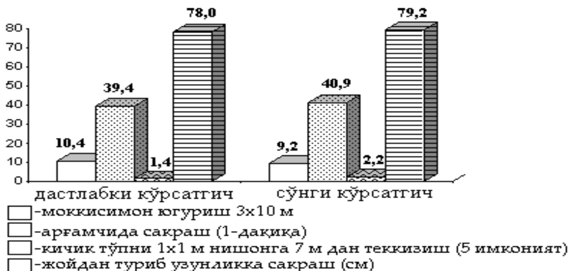
1-diagramma. 6-7 jash ul balalarda tezlik ko`rsetkishlerinin` da`slepki ha`m son`g`i na`tijeleri (NG)

Qadag`alaw toparında izertlew son`ında (5-keste) 6-7 jash ul balalarda tezlik testlerinin` ko`rsetkishleri: 1-test boyınsha ortasha o`lshem – 9,2; 2 – test boyınsha ortasha o`lshem – 40,9; 3 – test boyınsha ortasha o`lshemi– 2,2; 4 – test boyınsha 79,2 ni payda etedi.