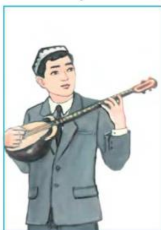
Sazende nama shertedi.