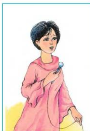
Qosıqshı qosıq aytadı.