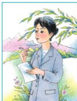
Shayıra qosıqtın' so'zin jazadı.