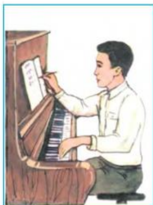
Kompozitor muzıka do'retedi.

Balalar saz-ásbablarında (kishkene doyra, duwtar, rubab h.t.b) ritm berip (shapalaq qaǵıp)ózleri oylap tapqan háreketlerin islep oynaydı.