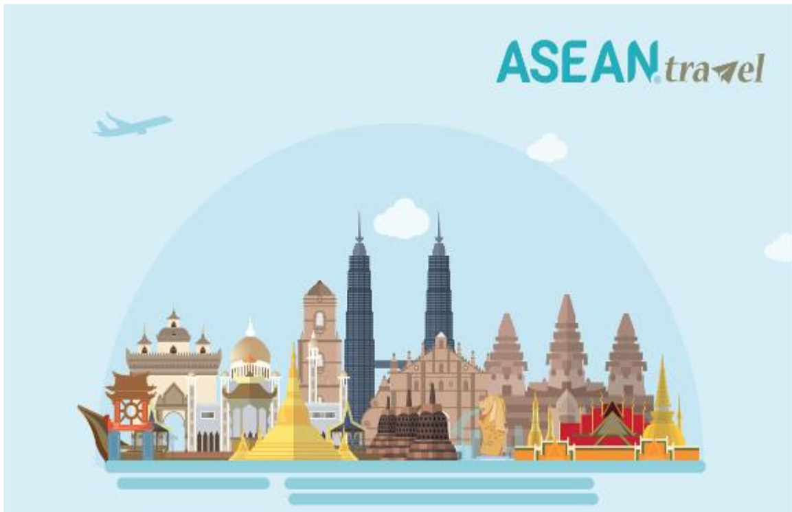
АСЕАН мамлакатларига саёхат