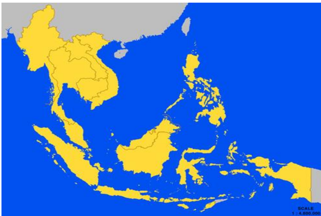
Тинч океани хавзасининг “Осиё йўлбарслари” давлатлари