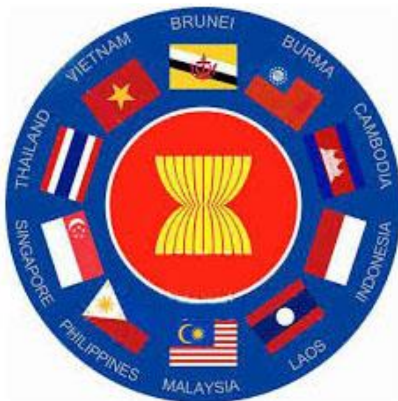
Жануби-Шарқий Осиё мамлакатлар уюшмасига аъзо мамлакатлар