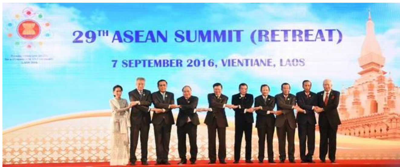
АСЕАН мамлакатлари 29-саммити. Лаос. 2016 йил, 7 сентябр.