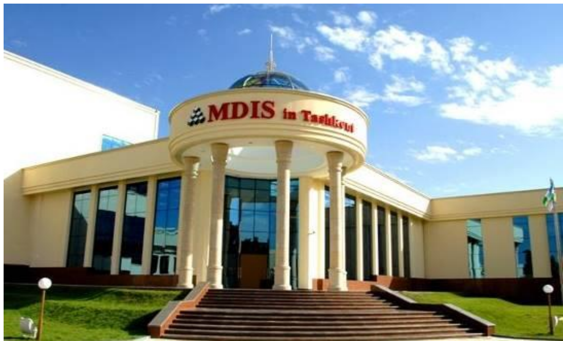
Тошкент шаҳридаги Сингапур менежментни ривожлантириш институти