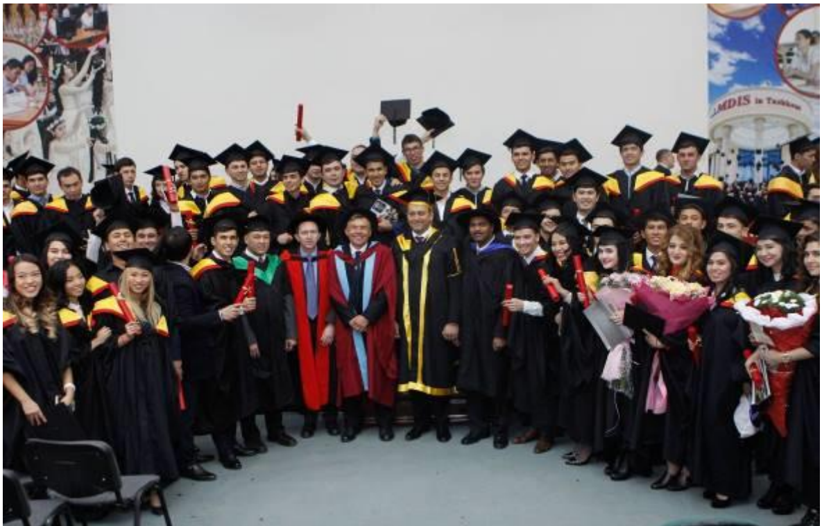
Сингапур менежментни ривожлантириш институтининг 2016 йил битирувчилари