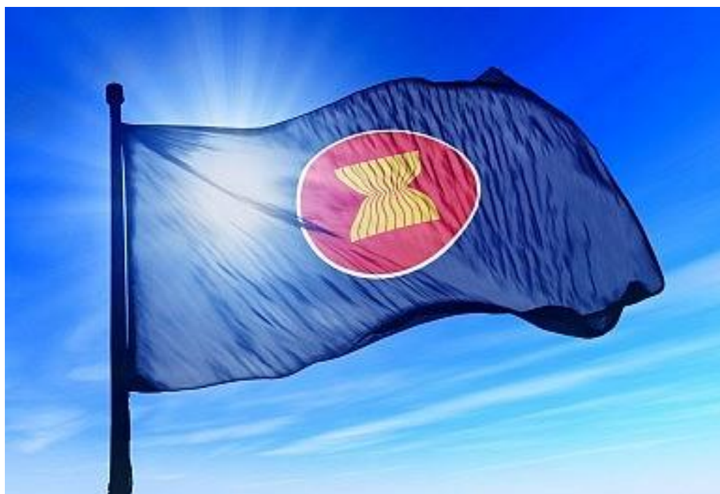
АСЕАН ташкилотининг байроғи