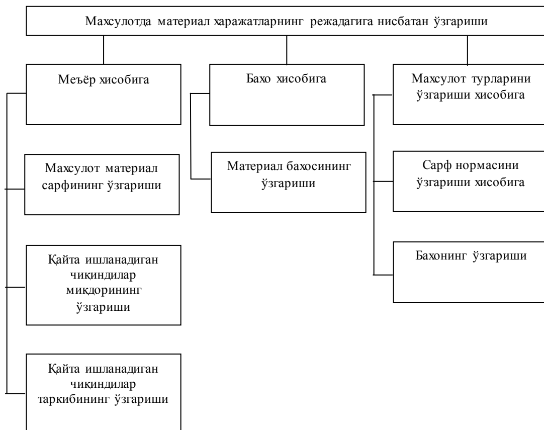
2.1 -чизма. Махсулот таркибидаги хом ашё ва асосий материалларга кетган харажатларни пасайтиришга таъсир этувчи омиллар

Бундай механизм корхонани ривожлантириш учун таъсирчан ички омилларни таъминлайди, истеъмолчи учун ишлашга, хом ашё ва асосий материалларни бутун чоралар билан тежашга, фан ва техника ютуқларини кенг қўллашга ундайди.