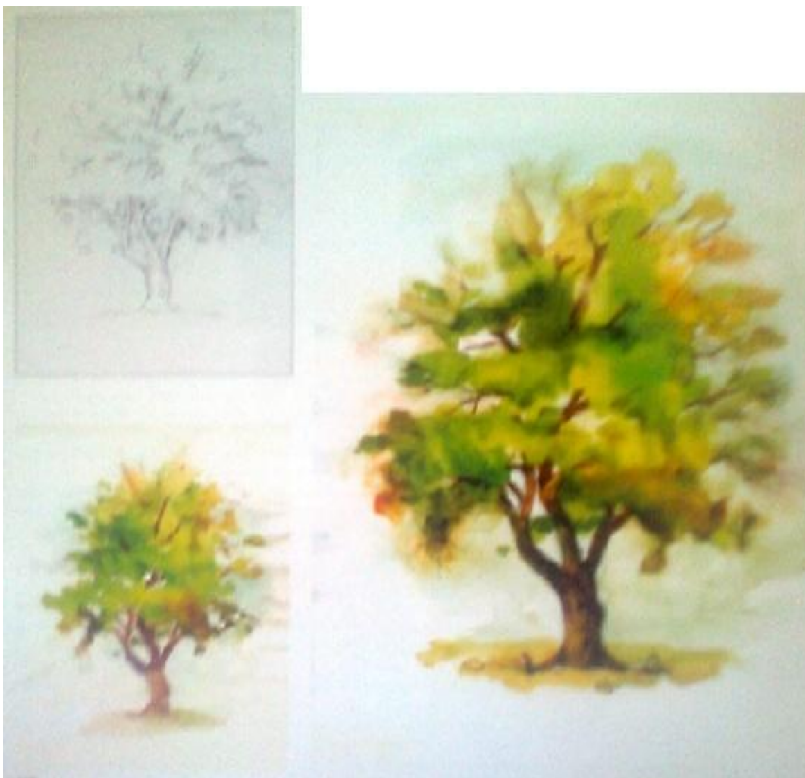
4-rasm Daraxt tasvirlash namunasi