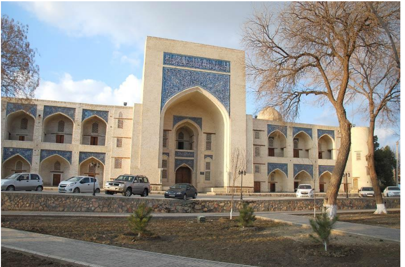
Ko'kaldosh madrassasi restavratsiyadan keyin