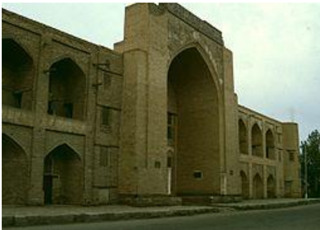
Ko'kaldosh madrassasi restavratsiyadan oldin