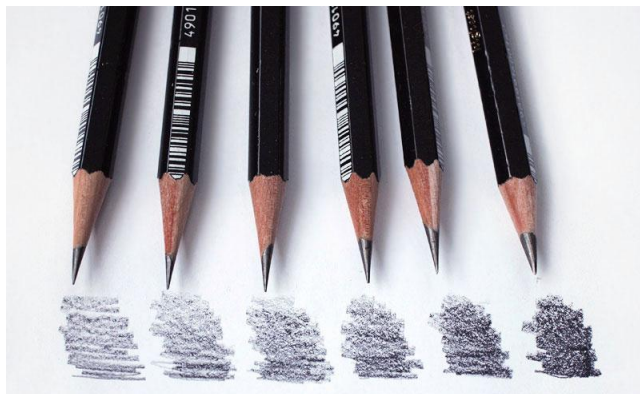
(рис3) графические карандаши

графиту. Рисунки, выполненные этим материалом, имеют сероватый тон с легким блеском, в них нет интенсивной темноты;