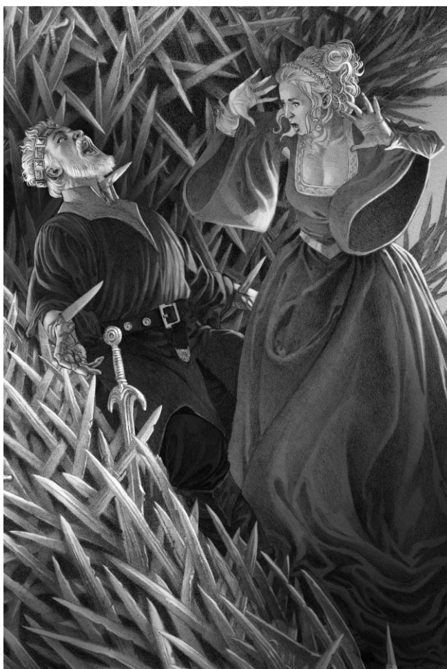
(рис) Эйдлин обнаружила Гарри мертвым

Следующий художник Даг Уитли (Doug Wheatley) стал главным иллюстратором книги «Мир Льда и Пламени», чьи работы стали ее оформлением. Канадский художник Даг Уитли (Doug Wheatley), наиболее известный своими работами для франшизы «Star Wars» . Был приглашен для работы над первым томом «Пламени и крови» и создал для книги около 80 черно-белых иллюстраций.