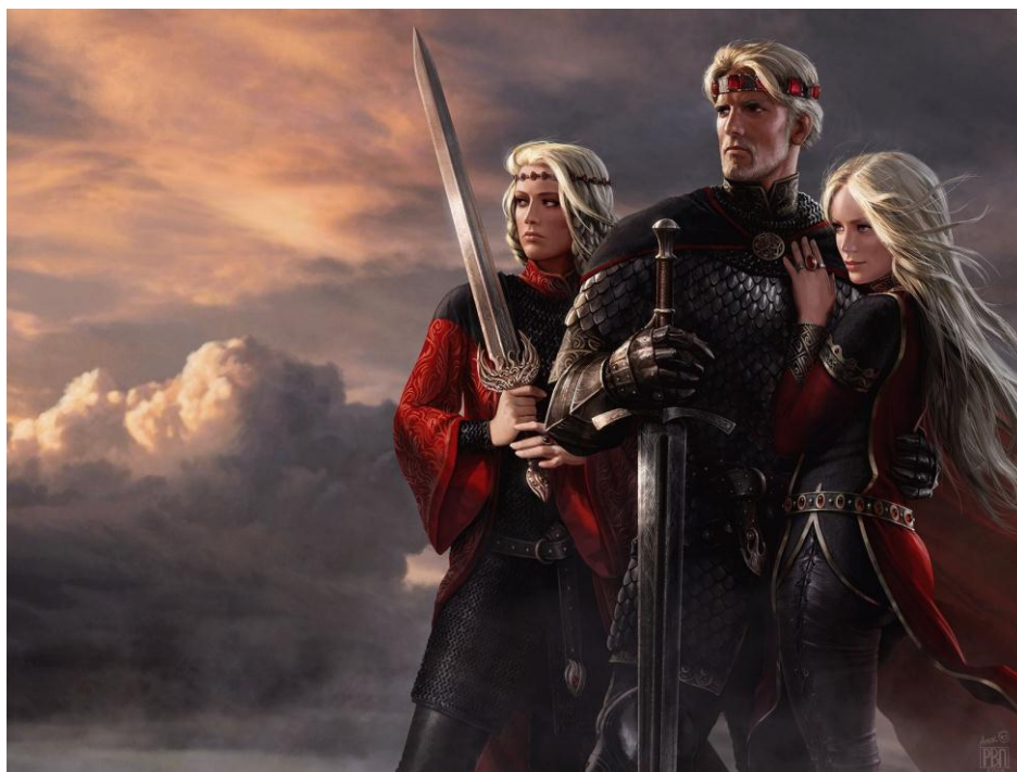
(рис) Картина «Эйгон и его сёстры» по книгам Джорджа Мартина, нарисованная специально для выставки в Лос-Анджелесе