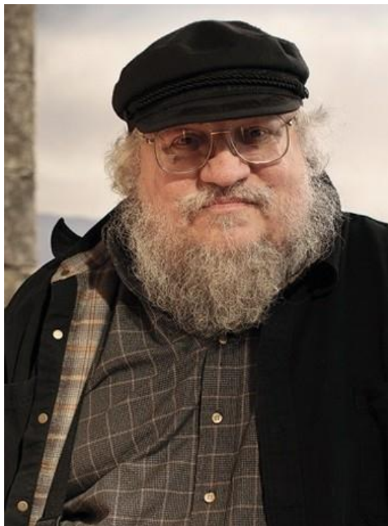
(рис.1). Джордж Рэймонд Ричард Мартин

Джордж Рэймонд Ричард Мартин – американский писатель-фантаст, лауреат многих литературных премий. В 1970-е - 1980-е годы получил известность благодаря рассказам и повестям в жанре научной фантастики, литературы ужасов и фэнтези. Наибольшую славу ему принес выходящий с 1996 года цикл романов в жанре фэнтези «Песнь Льда и Огня», также экранизированный компанией НВО в виде популярного телесериала «Игра престолов». Эти книги дали основания литературным критикам называть