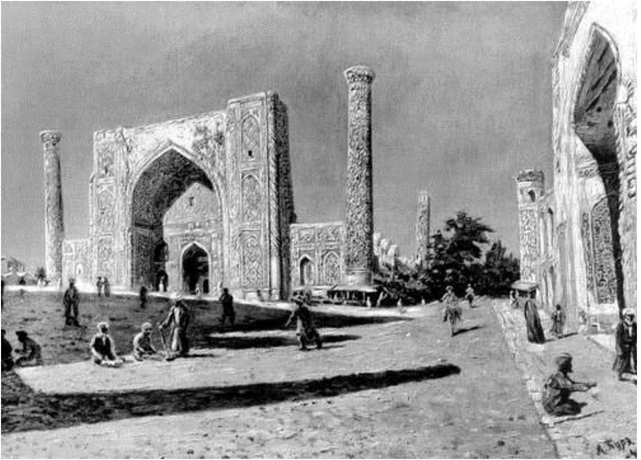
Samarqand Ulug'bek madrasasi 1911-1958 yillar