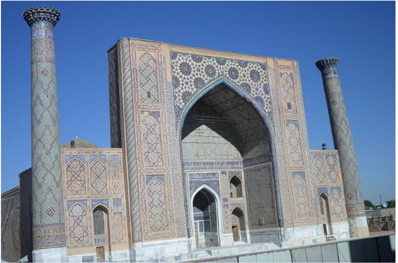
Mirzo Ulug'bek madrasasi tashqi ko'rinishi 1911 arxiv materiali