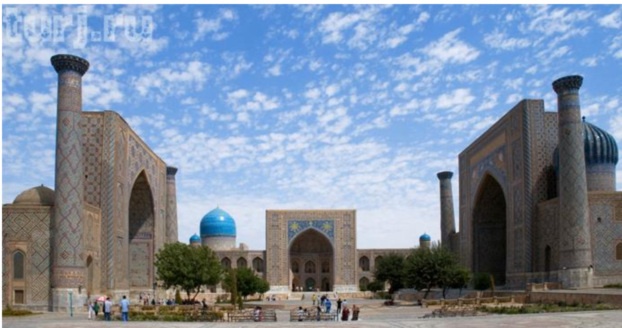
Samarqanddagi Mirzo Ulug'bek madrasasi tashqi ko'rinishi 2015 yil