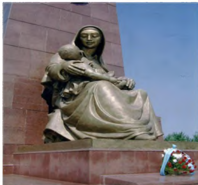
Mustaqillik va ezgulik monumenti