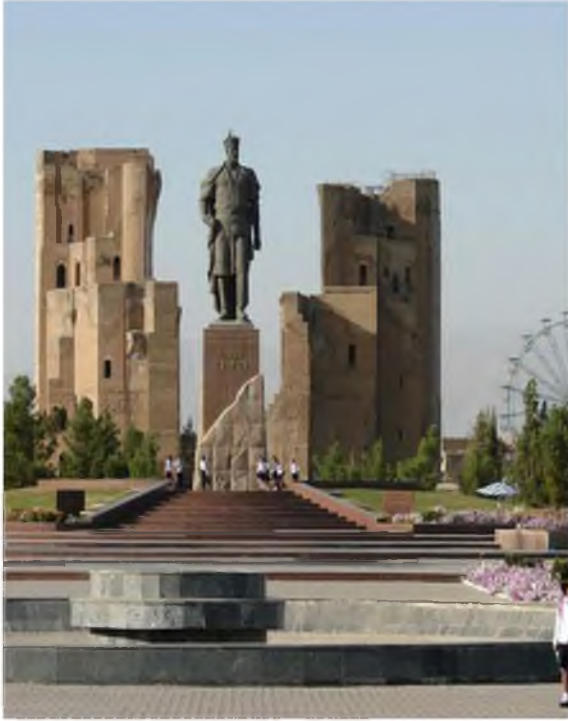
Amir Temur. Shahr-i Sabz.