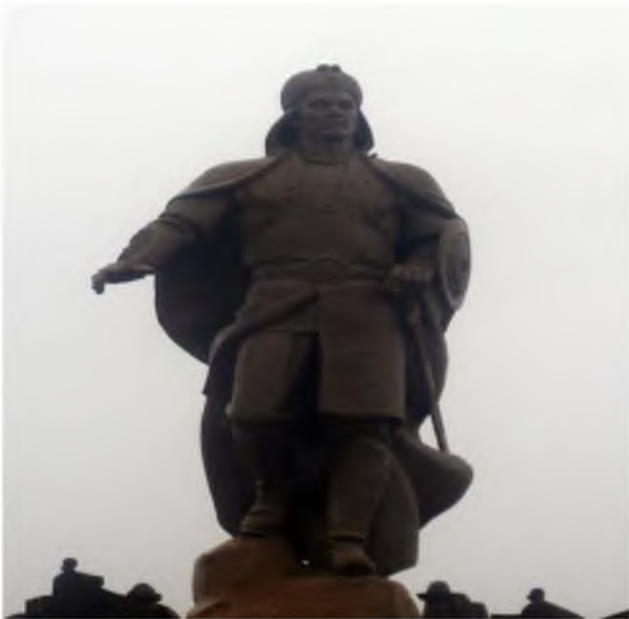
Jaloliddin Manguberdi. Xorazm