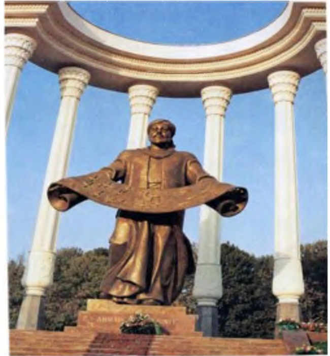
Al- Farg'oni. Farg'ona