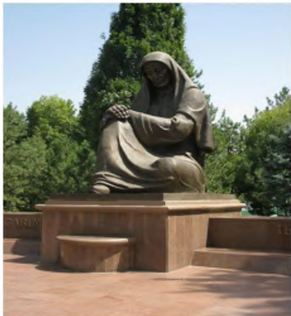
Motamsaro ona monumenti