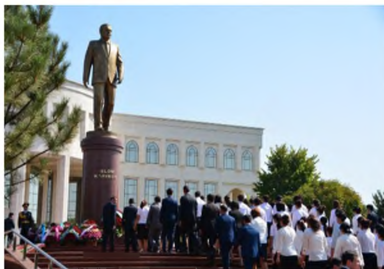
Islom Karimov haykali. Toshkent.