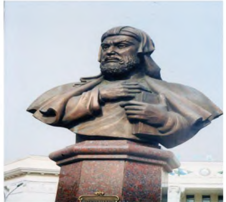
Nizomiy Ganjaviy. (bust)