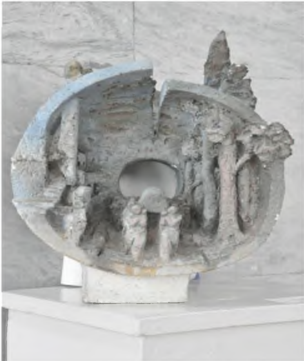
Tug'ilish va o'lim (shamot)