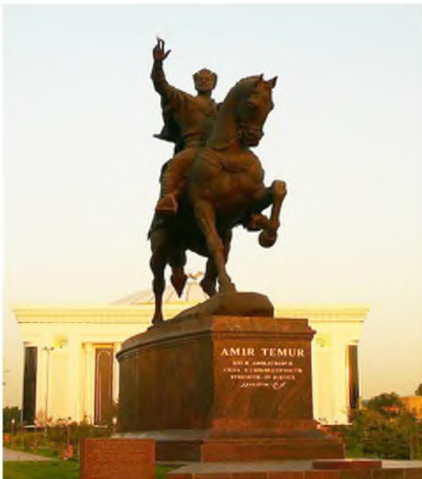
Amir Temur. Toshkent