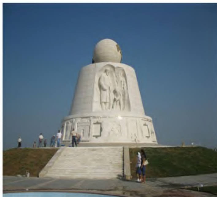
Ko'hna va boqiy Buxoro yodgorligi. Buxoro