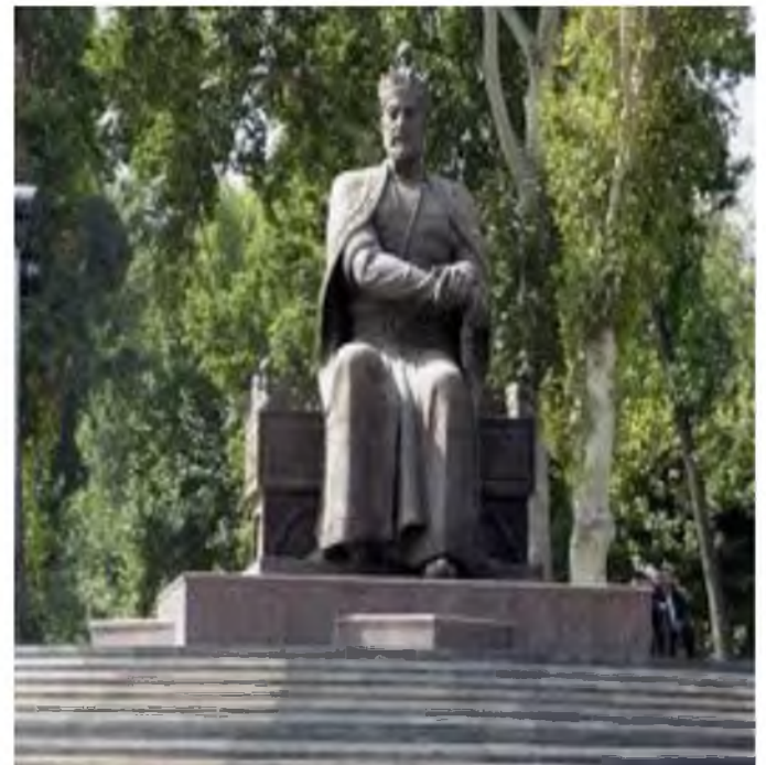
Amir Temur. Samarqand.