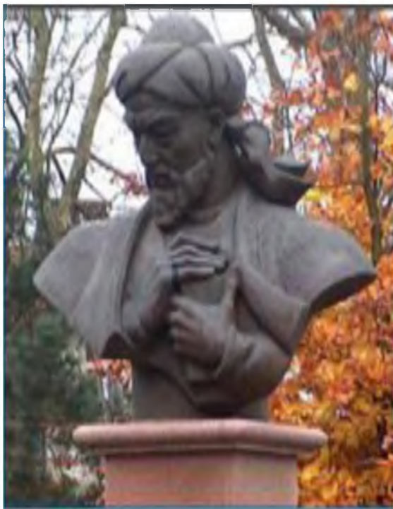
Ibn Sino (byust) Belgiya Kortreyk shahri