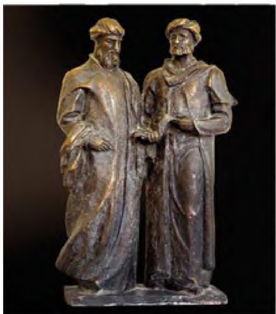
Navoiy va Jomiy (bronza)