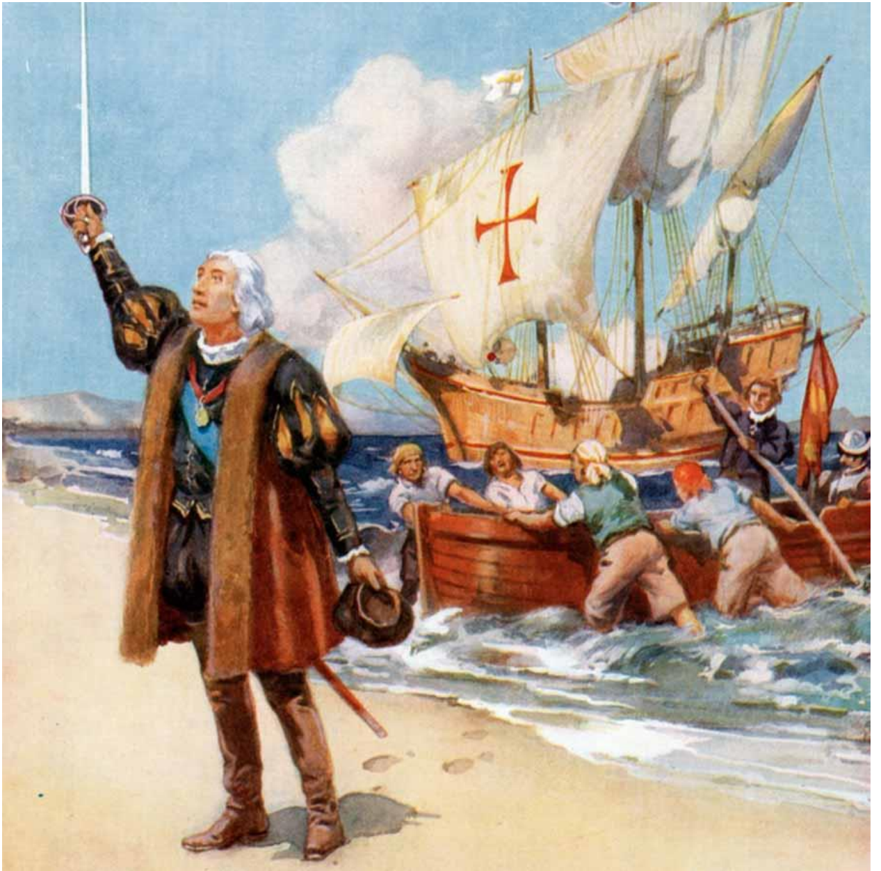
9-rasm.X.Kolumb San-Salvador orolida