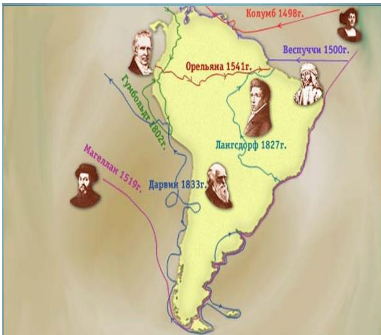
2-rasm. Janubiy Amerikaning o'rganilishi