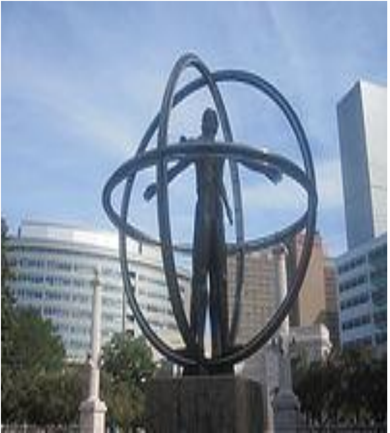
6-rasm.Kolorado shtatidagi X.Kolumb haykali