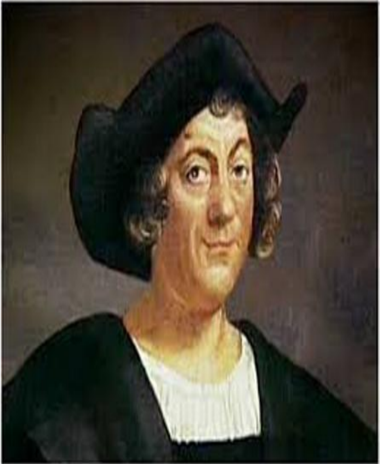
3-rasm. Xristofor Kolumb (1451- 1506)

Kolumbning shu tariqa Ispaniyaga kelishi ko'pchilikni hayratga qoldirdi. Axir u yangi orollar ochgan, katta xizmatlar ko'rsatgan "okean admirali" ediku? Jamoatchilik orasida norozilikdan cho'chigan korol, go'yo uni qamash to'g'risida buyruq bermaganday, "Kolumb darhol kishandan ozod etilsin" deb buyurdi. Korol va malika Kolumbga xat yozib, ikkiyuzlamachilarcha unga