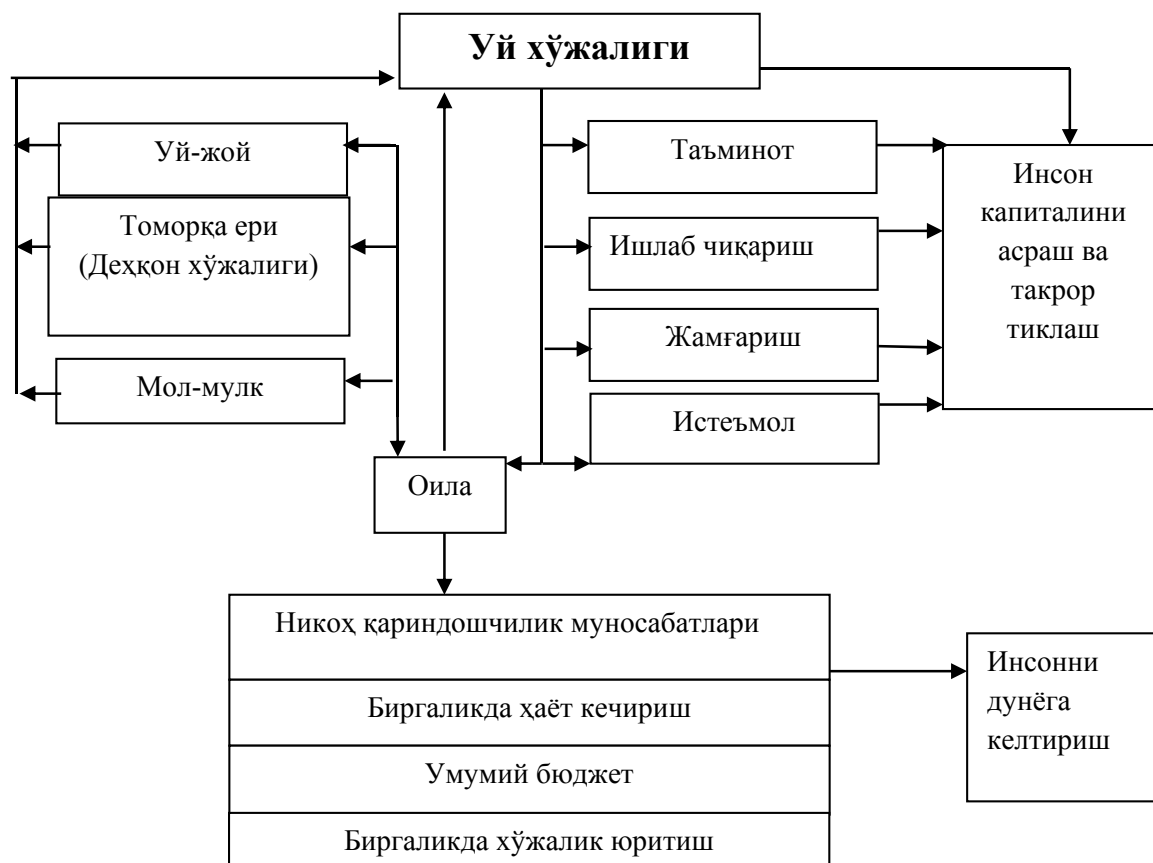
1-расм. Оила ва уй хўжалигининг таркибий тузилиши ва функциялари 11

Шундай қилиб, уй хўжалигига юқорида тавсифланган иқтисодий категория сифатида қуйидагича таъриф бериш мумкин. “Уй хўжалиги – бу инсон капиталини такрор тиклаш ва уни амалга оширишнинг асосий ижтимоий-иқтисодий бирлиги, якка ёки биргаликда яшовчи ва биргаликда хўжалик юритувчи оила аъзолари томонидан таъминланадиган яхлит ҳаёт фаолияти тизими ҳисобланади.