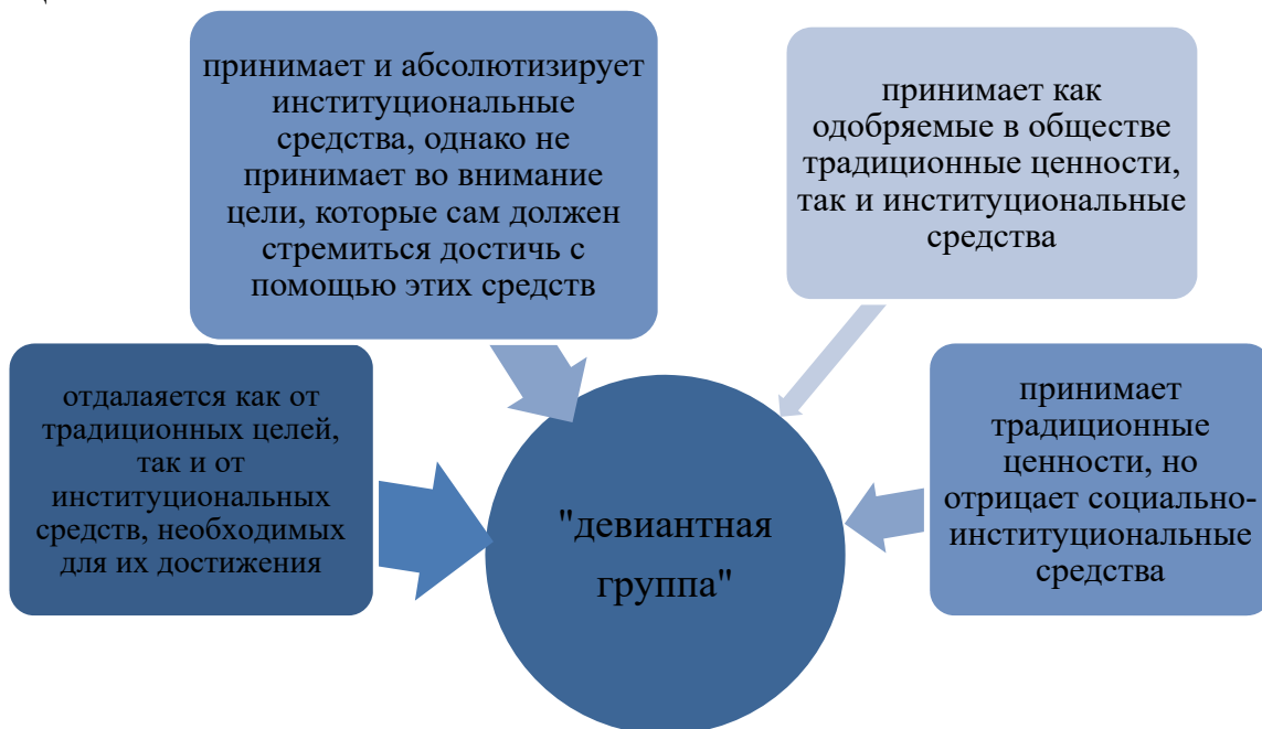
Рис. 1. Вклад социальных групп учащейся молодежи в девиантную группу

Подход к учащимся на основе их деления на социальные группы основан на их конструктивном осознании жизни наряду с возникновением динамики коллективного подхода к действительности. Ниже на схеме отражен вклад в группу девиантности четырех дифференцированных групп учащихся.