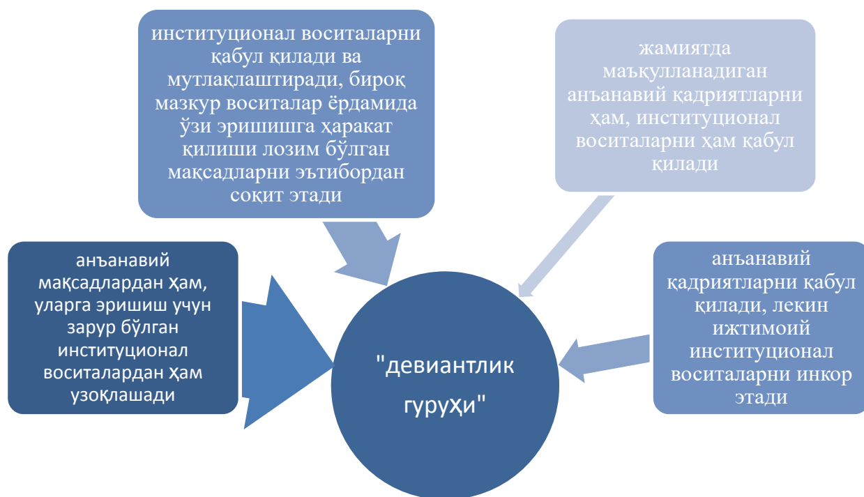
1-расм. Ўқувчи-ёшлар ижтимоий гуруҳларининг девиантлик гуруҳига қўшаётган ҳиссаси

Ўқувчиларни ижтимоий гуруҳларга ажратиб ёндашиш уларда ҳаётни конструктив англаш билан бирга, воқеликка жамоавий ёндашиш динамикасини юзага келтириши асосланган. Қуйидаги чизмада ўқувчилар тоифалаштирилган тўртта гуруҳининг девиантлик гуруҳига қўшаётган ҳиссаси акс этган.