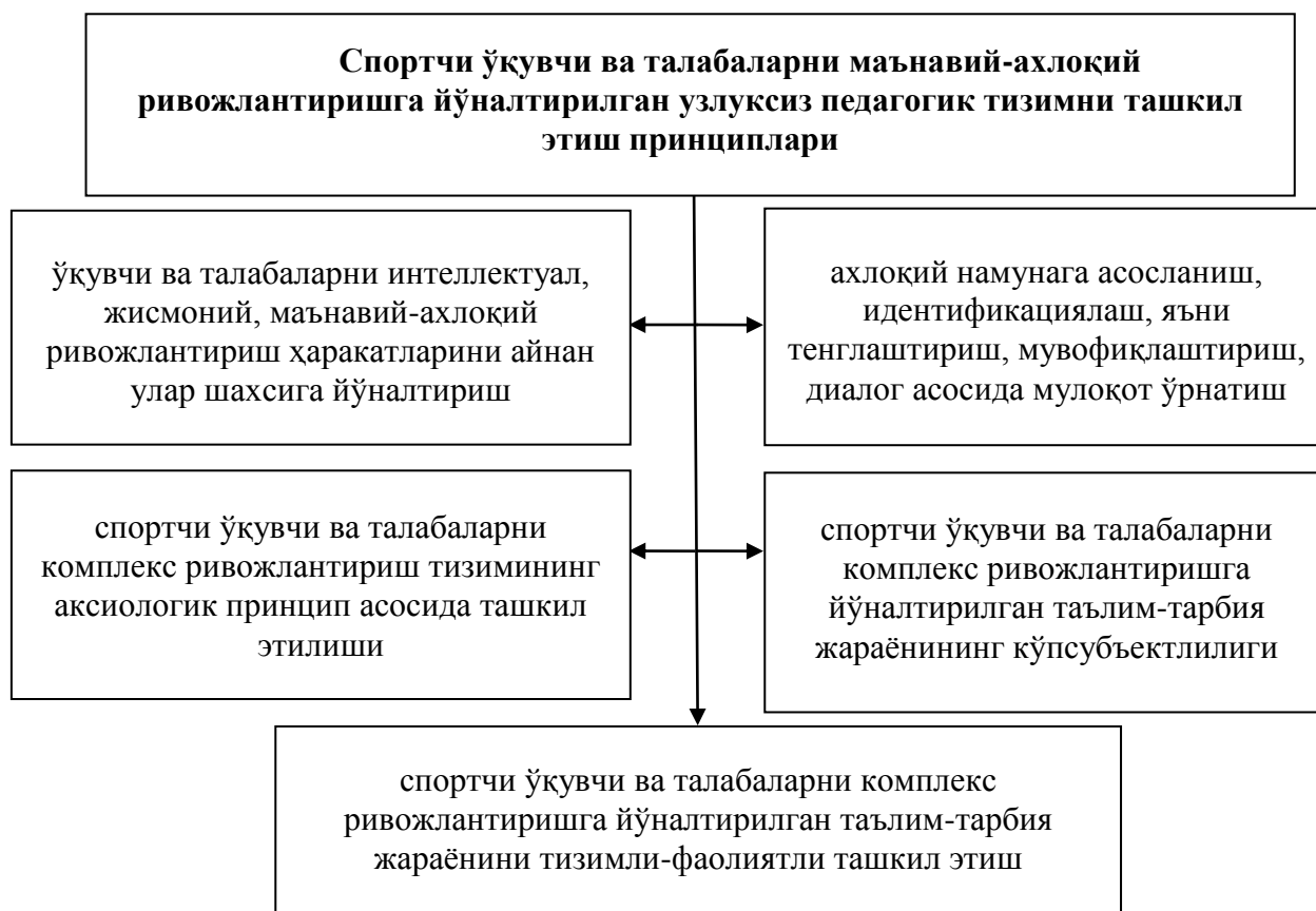
1-расм. Спортчи ўқувчи ва талабаларни маънавий-ахлоқий ривожлантиришга йўналтирилган узлуксиз педагогик тизимни ташкил этиш принциплари

Диссертациянинг “Уч босқичли спорт мусобақалари”нинг ўқувчи-талабаларни интеллектуал, маънавий-ахлоқий, жисмоний, эстетик ривожлантиришдаги педагогик самарадорлиги ” деб номланган учинчи бобида “Уч босқичли спорт мусобақалари”ни ташкил этишга бўлган янги талабаларни аниқлаш ва тизимлаштириш, таълим олувчилар шахсини комплекс ривожлантиришда “Уч босқичли спорт мусобақалари” самарадорлигининг статистик таҳлили хусусида фикр юритилган.