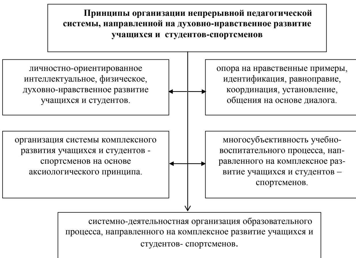
Рис.1. Принципы организации непрерывной педагогической системы, направленной на духовно-нравственное развитие учащихся и студентов-спортсменов.

Для повышения эффективности духовно-нравственного воспитания получателей образования целесообразно установить сотрудничество образовательного учреждения с партнёрами. В результате родители будут более внимательно относиться к спортивным способностям и интересам своих детей и создавать необходимые условия для занятий детей спортом. На всех этапах непрерывного образования требуется внедрение программ духовно - нравственного развития учащихся и студентов-спортсменов. Внедрение таких программ приведет к достижению ожидаемых результатов.