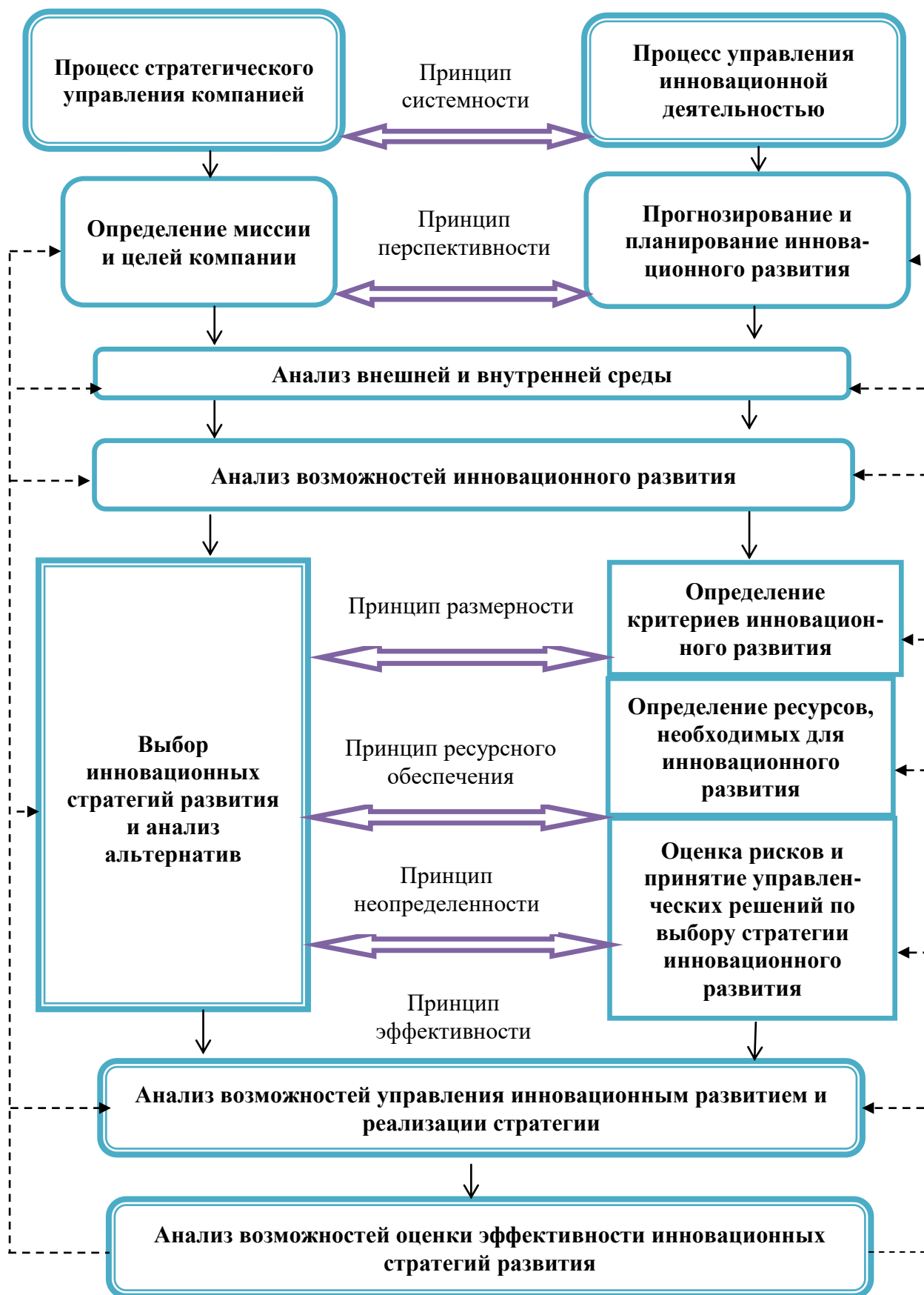
Рисунок 2. Модель выбора и реализации стратегии инновационного развития АК «Узбектелеком» 13