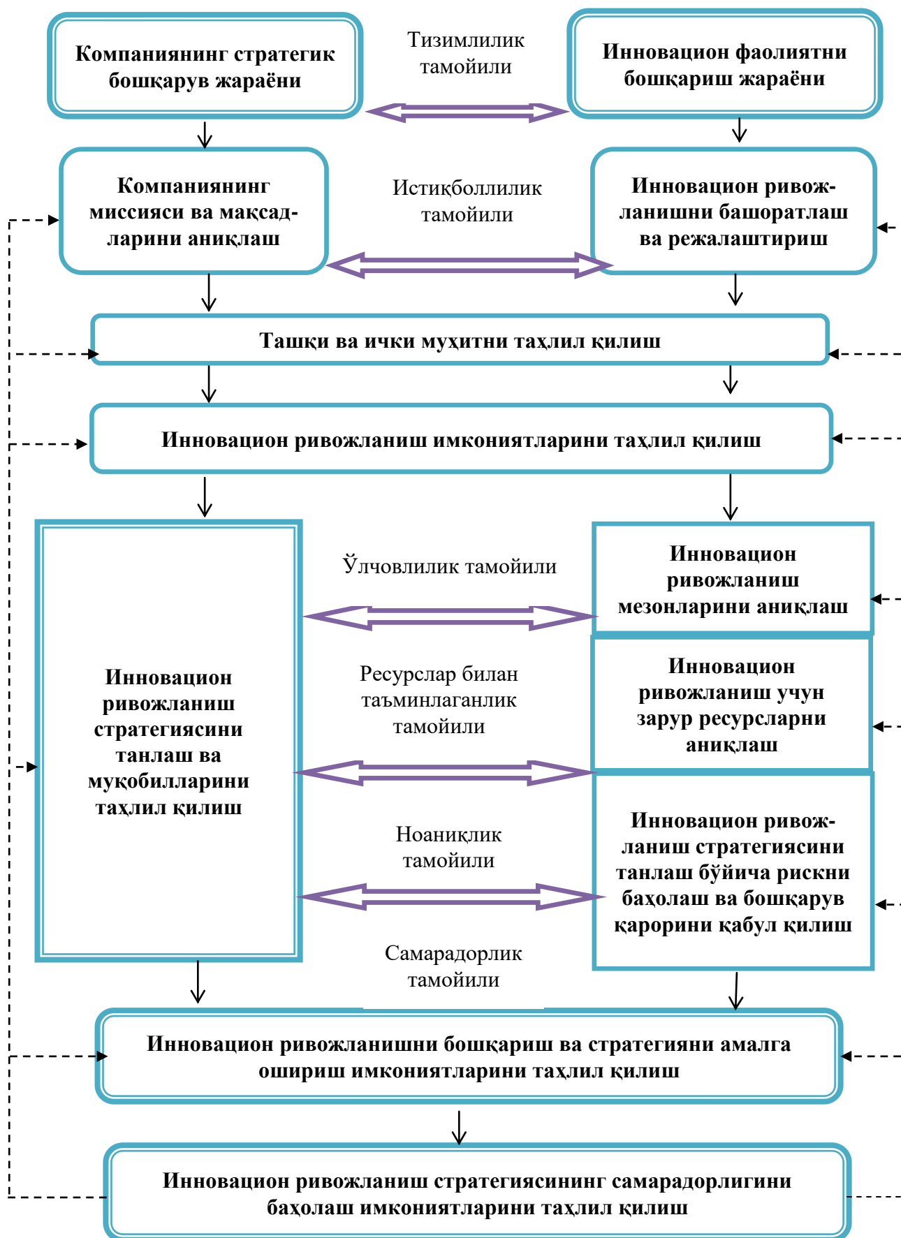
2-расм. «Ўзбектелеком» АК нинг инновацион ривожланиш стратегиясини танлаш ва амалга ошириш модели 13