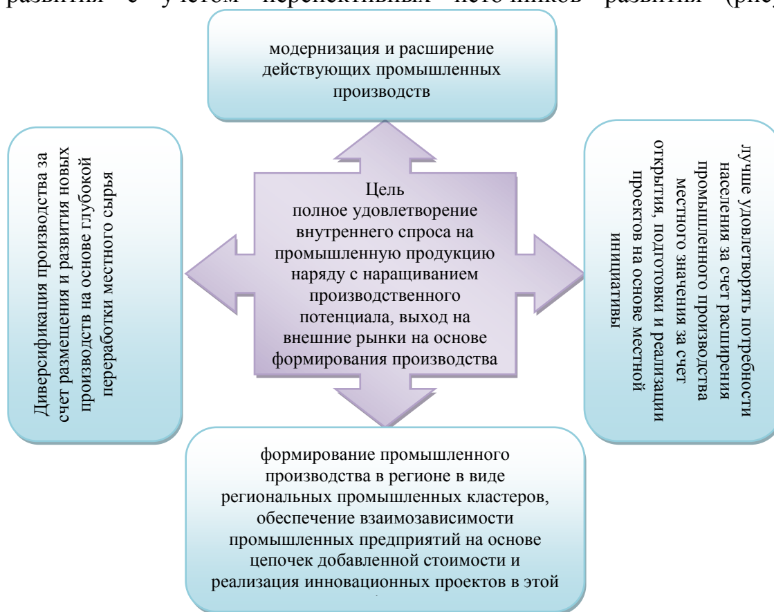
Рис.3. Стратегические направления развития промышленности в Республики Каракалпакстан

Автором разработаны стратегические направления промышленного развития, на основе оценки потенциала и сравнительных преимуществ, присущие промышленности Республики Каракалпакстан, анализа тенденции развития с учетом перспективных источников развития (рисунок 3)