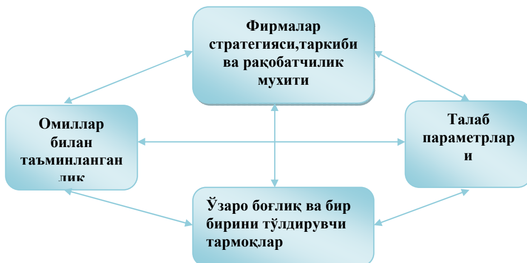
1.1-расм. Мамлакатнинг рақобат жихатдан устунлигини ташкил этувчи унсурлар

1.Мехнат, материал, билим, пул, инфратузилма ресурслари билан таъминланиш мамлакатнинг рақобатдошлигига ижобий таъсир кўрсатади. Бу ресурсларнинг баъзилари олдиндан мавжуд бўлса, айримлари яратилади ва ривожлантирилади.