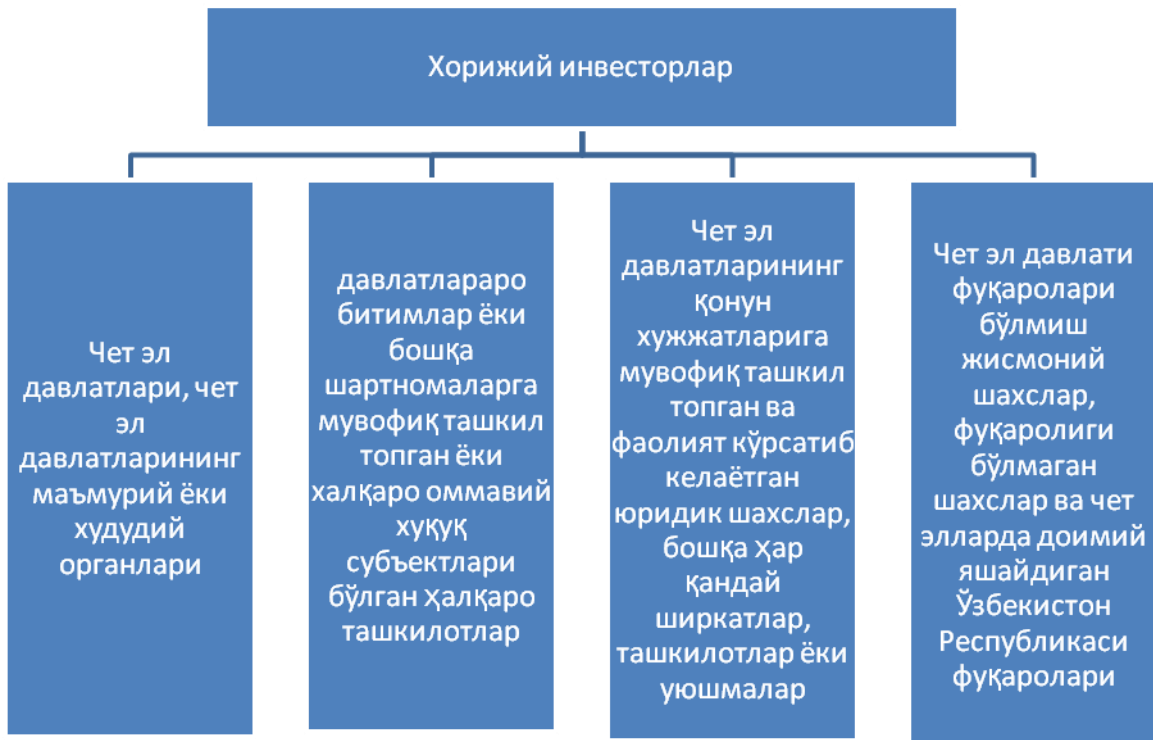
1.2-чизма. Хорижий инвесторлар.

Ўзбекистон Республикасининг “Чет эл инвестициялари тўғрисида”ги Қонунига кўра Ўзбекистон Республикасида қуйидагилар чет эллик инвесторлар бўлиши мумкин (1. 2 - чизма).