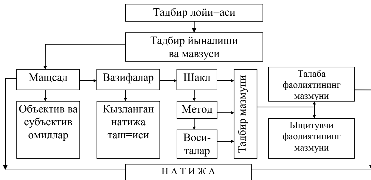
2.2.1 – расм. Тарбиявий тадбирларнинг умумий лойиҳаси

2.2.1. шаклда келтирилган схема асосида иш кўришлари тавсия этилди: