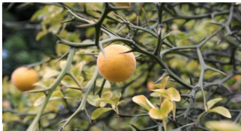
1.1.1-rasm. Citrus (1), Fortunella (2) va Poncirus (3) mevalari

Sitrus ekinlarning sistematikasi va tasnifi hozirgi kunga qadar murakkab masalaligicha qolmoqda. Buning asosiy sababi shuki, Citrus L. Avlodida haddan tashqari polimorfizm kuzatiladi.