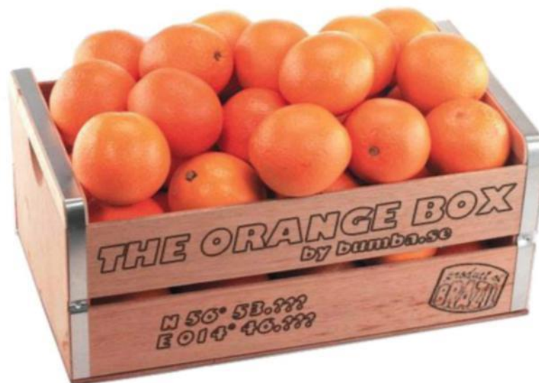
3.1-rasm. Sitrus mevalari uchun mo'ljallangan quti

Dunyoning ko'pgina mamlakatlarida Sitrus mevalari sig'imi 16-20 kg bo'lgan qutilarga joylanadi (3.1-rasm).