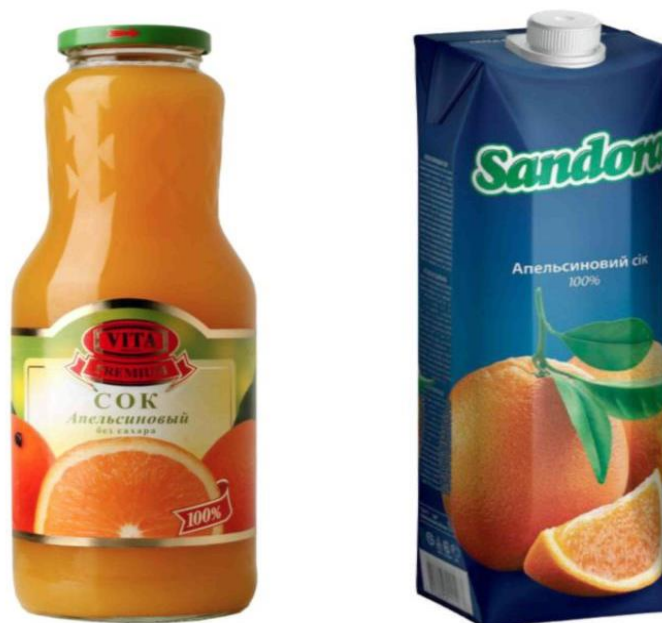
4.1-rasm. Sitrus (apelsin) sharbatlarini zamonaviy usulda qadoqlash

korobkalar ham keng tarqalmoqda. Ular tashish, saqlashga qulay bo'lishi bilan bir qatorda xaridorgir ham hisoblanadi (4.1-rasm).