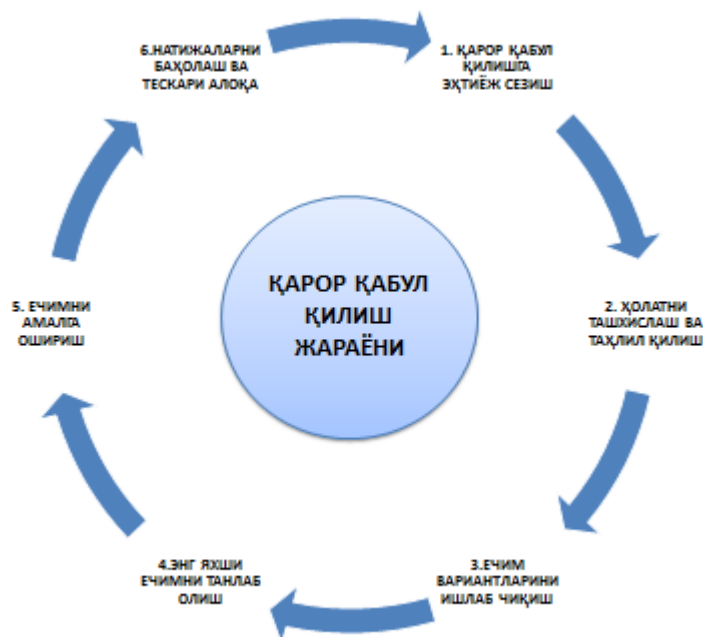
3-расм. Бошқарув қарорларини қабул қилишнинг асосий босқичлари 9 .

ўртасидаги доимий боғловчисиз алмашинув корхона тизими каби шакллана олмайди.