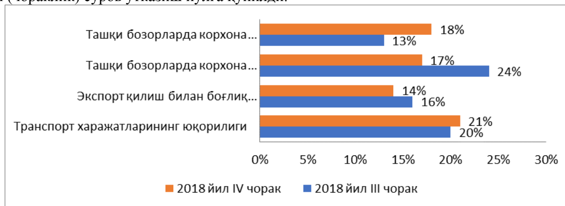
1–расм. Экспорт ҳажмининг ўсишига тўсқинлик қилаётган омиллар бўйича жавобларнинг тақсимланиши [3]

Масаланинг мазмуни. 2018 йилнинг II чорагидан бошлаб, иқтисодиёт реал сектори корхоналарининг жорий иқтисодий ҳолати ва истиқболдаги кутилмаларини ўрганиш юзасидан даврий (чораклик) сўров ўтказиш йўлга қўйилди.