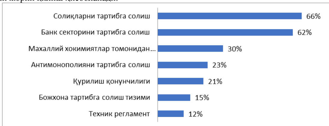
2-расм. Бизнесни ривожлантиришга салбий таъсир кўрсатадиган тартибга солиш омиллари (Респондентлар умумий сонининг %и ) [3]

Тадбиркорлик субъектлари муаммоларини муваффақиятли ҳал қилиш, ишлар сифатини ошириш ва ушбу соҳани ривожлантиришнинг асосий омилларидан бўлиб, АКТ асосида самарали тизимни жорий қилиш ҳисобланади.