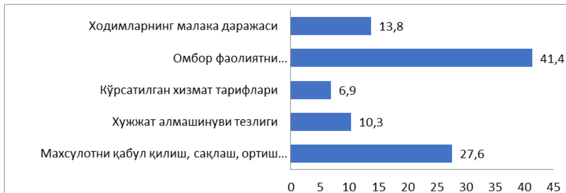
3- расм. Ўзбекистон Республикаси тадбиркорлари билан транспорт ва омбор- логистика ҳолати бўйича ўтказилган сўров натижалари [4]

Иккинчи сабаб – маҳсулотни қабул қилиш, сақлаш, жўнатиш бўйича номукамал омбор технологияси (28%) бўлиб, бу узоқ муддатли тушириш, транспортнинг узилиши, товарларнинг узоқ муддатли жойлаштириш ва бошқалар каби оқибатларга олиб келади.