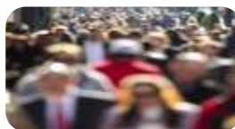
Чўзиқ (кенглик) агломерация

“Агломерация” деганда шундай ҳудудий – иқтисодий ҳосила тушуниладики, бу ҳосила йирик шаҳар (ёки зич жойлашган бир неча шаҳарлар – конурбация) негизида пайдо бўлади ва урбанизациянинг каттагина зонасини шакллантиради, ён – атрофидаги аҳоли пунктларини ўзига қўшиб олади. Хилма – хил моддий ва номоддий ишлаб чиқариш корхоналари, биринчи галда саноат корхоналари инфраструктура объектлари, илмий ва ўқув муассасаларининг юксак даражада ҳудудий концентрациясини вужудга келтиради. Шунингдек, аҳолининг ўта зич жойлашганлиги билан бошқа ҳудудлардан фарқ қилади[Ш., 22].