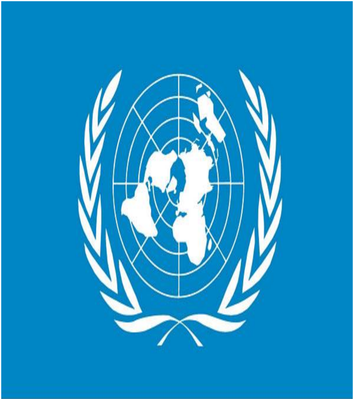
Бирлашган Миллатлар Ташкилотининг байроғи