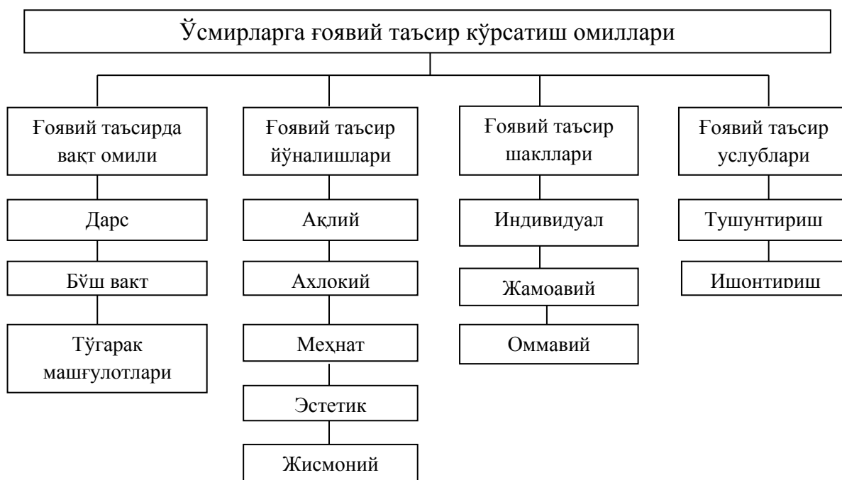
2-Расм. Ўсмирларга ғоявий таъсир кўрсатиш омиллари.

Ушбу бобда яна муסיкий тўғараклар фаолиятида ўсмирларни ғоявий тарбиялашни ижтимоий ҳаёт шароитлари билан боғлаб олиб бориш; ўсмирларни ижтимоий ва маданий йўналтириш; муסיқа воситасида маънавий фаоллигини оширишга қаратилган амалий фаолиятни ташкил этиш; маънавийлилик, комиллик белгиларини шакллантириш; миллий қадриятлар ва урф-одатларга садоқат; ҳурмат руҳида тарбиялаш; муסיкий идрокни шакллантириш; муסיқанинг назарий ва амалий жиҳатлари билан таништириш; муסיқа санъатининг имкониятларидан, миллий-муסיкий меросдан тўлақонли фойдаланиш; ўзбек муסיқа таълим-тарбияси, педагогикаси ва унинг мукамал услубиётлари, устоз ва шогирт анъаналиридан фойдаланиш; профессионал муסיқа, ҳалқ оғзаки ижодиёти намуналаридан фойдаланиш; муסיқанинг ифодавий тили (қуй, гармония, ритм-усул, суръат, ўлчов, регистр, динамик белгилар ва бошқалар) ҳақида тушунчалар бериш; муסיкий жанрларни фарқлай олишга ўргатиш; маҳаллий услублар, уларнинг ижрочилари ҳақида тушунчалар бериш; муסיқада замонавийлилик ва замонавий муסיқа, эстрада муסיқаси ва унинг ижрочилари ҳақида тушунчалар бериш; мутахассислиги бўйича ижрочилик услублари билан таништириш каби педагогик шарт-шароитлар акс этирилган. Шунингдек, ўсмир ёшларда бадиий воситалар орқали миллий ғоя тушунчаларини шакллантириш жараёнида ривожлантириш учун қуйидаги назарий ва амалий хулосаларга тўхталиб ўтиш жоиз: