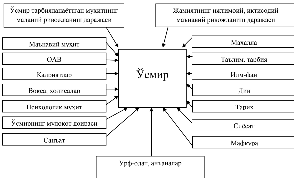
1-расм. Ўсмир онги, тафаккурига таъсир этувчи ижтимоий-педагогик омиллар тизими

Юқорида айтилган фикрлардан келиб чиққан ҳолда, ўсмирларнинг мактабдан ташқари таълим муассасаларидаги муסיқий тўғараклар фаолиятида маънавий ва ғоявий жихатдан шаклланишга таъсир этадиган ижтимоий-педагогик омиллардан қуйидагиларни кўрсатиш мумкин.