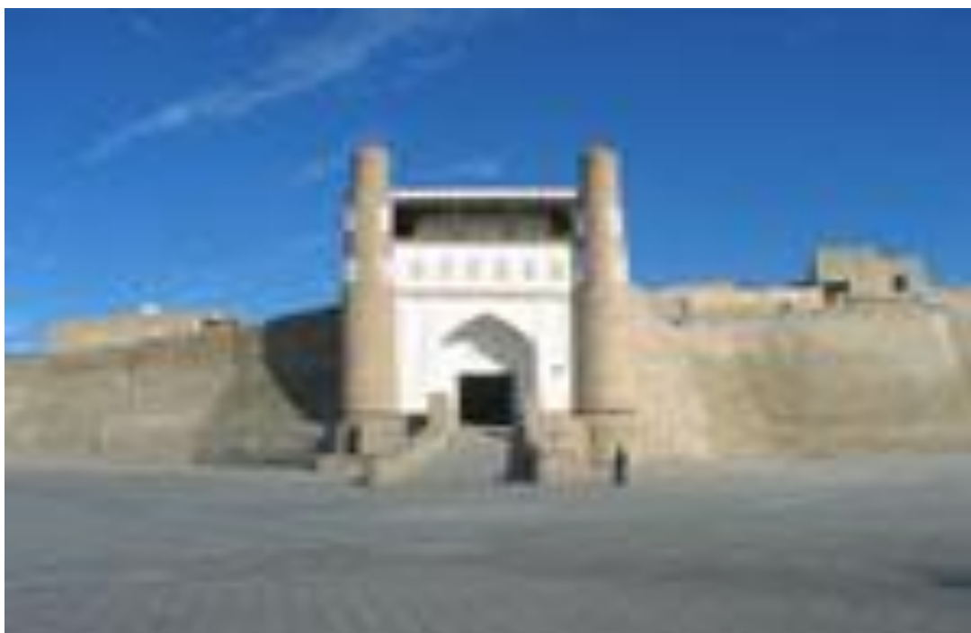
Buxoro Arki – hukmdor saroyi.