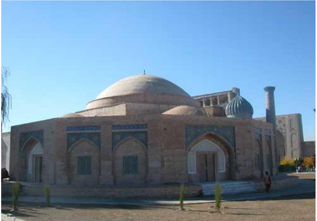
Amir Shohmurod qurdirgan Chorsu. (Samarqand. XVIII asr)